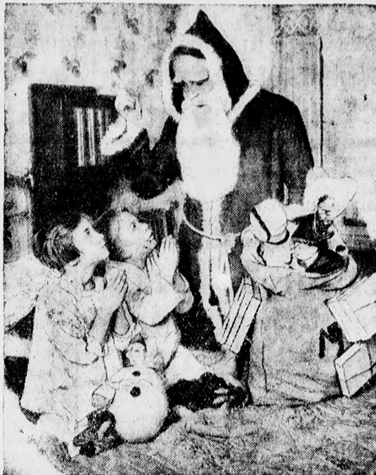
MEGJÖTT A MIKULÁS.

Valami szerény ajándék azért mégis csak került minden gyermek számára s így — ha szerényebben is, mint azelőtt —, de most is örömet hoz a Mikulás a debreceni gyerekeknek.