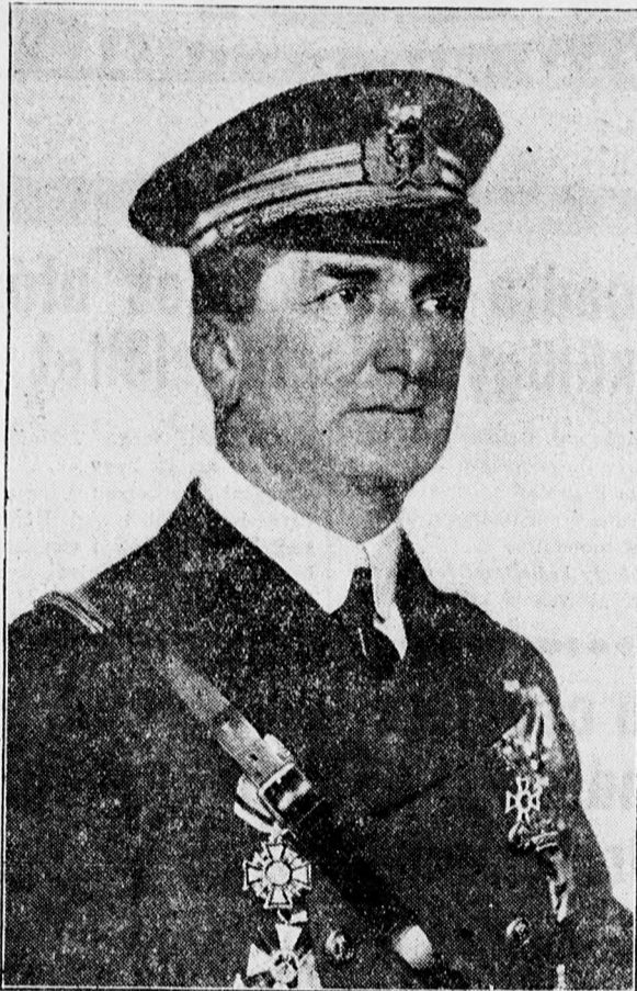
Nagybányai Horthy Miklós kormányzó.

Horthy Miklósnak, Magyarország kormányzójának nevenapját ezuttal is különleges ünnepléssel ülték meg a magyar városokban. Debrecenben is fáklyás menetet rendezett az egyetemi hallgatóság pénteken este, a katonaság pedig zenés takaróval adott tisztességet ennek a napnak. A különböző felekezetek templomaiban holnap reggel istentisztelet lesz a kormányzó nevenapja alkalmából.