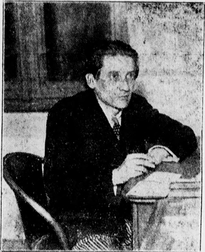
Kodolányi János, az országhírű fiatal magyar író Debrecenben tartózkodik, hogy adatokat és impressziókat gyűjtsön nagy tanulmányához, amelynek megírására a „Nyugat” szólította fel.

Férfi pizsama 8-50 pengő KONTSEK divatruházában.