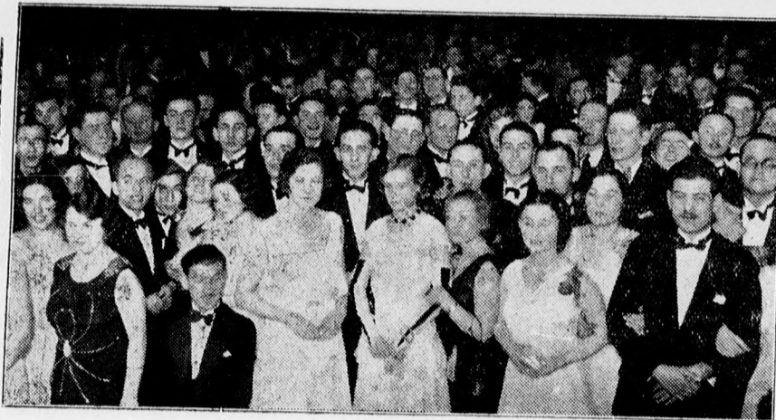
Az Izraelita Nőegylet szombati bálja közönségének egy csoportja.

Engel László ékszerésznél PIAC UCCA 52. SZ. a megyeház mellett.