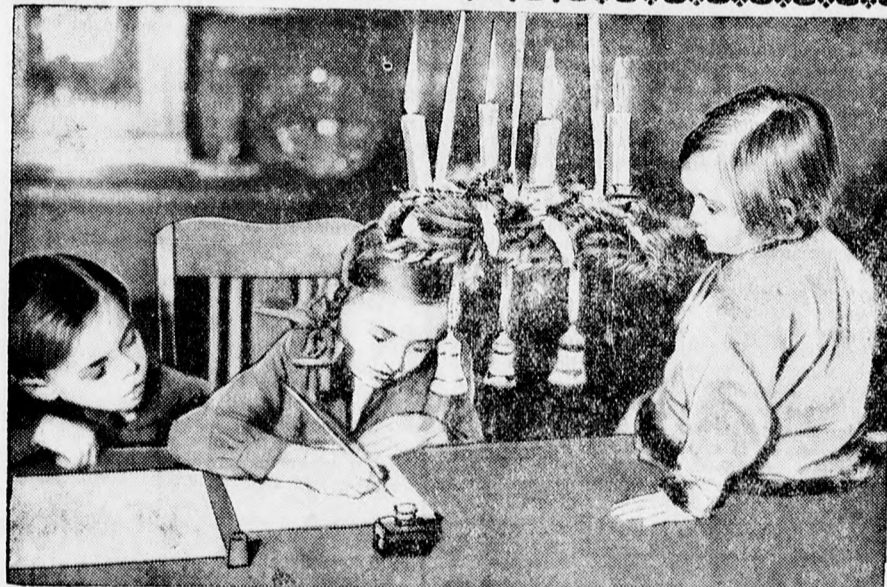
Megkezdődik a karácsonyi levélírás a Jézuskához.