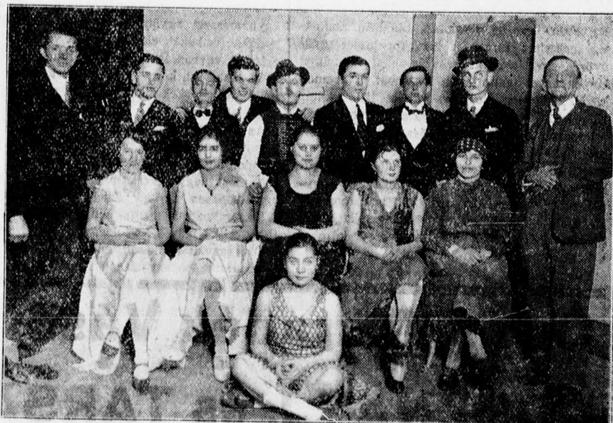
Az iparostanonciskola levente ünnepélyének szereplői.

tétele, amelynek összege 5.458.186 pengő és a rendszeres illetmények összegének több mint 15 százalékát teszik ki. A dologi kiadások végösszege 1929-ben 3.5 millió pengő, ami az