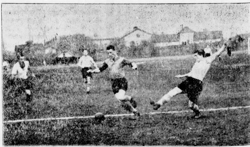
Igy játszik Teleky. Három játékos is magárvon és csak aztán ugrasztja ki valamelyik partnerét.

LIENER fényképező legújabb fényképbiztonságát a Csapó ucca 1. alatt.