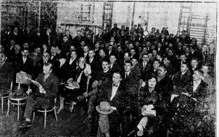
A Debreceni Villany és Víznyomó Vállalat találmánybemutató előadásának közönsége.

Még egy hét és itt a karácsony. Az üzletek kirakatain kívül, amelyek fényben, csillogásban, izléssel kínálják a legszebb, a legkiválóbbat, mindegyiken a kiáltó olcsó, de jaj soknak mégis olyan ár, amelyet a szájukon nem szabad kiejteni — a zöld karácsonyfa mutatja, hogy közeledik s gyorsan közeledik a karácsony. Az utcákon, udvarokon megjelent a zöld fény: négy-öt méteres hatalmas, fiatal örökzöld fatörzsek és apró kis csemeték, amelyeknek egyenlően az a hivatásuk, hogy estére magafeléd boldogságot, örömet hozzon és hordozzon egy ablakos kis szobákba s tükörüveges ablaku termekbe. Mint minden évben, most is igen szép fákot hozott a Kossuth uccai Simkovits cég (Kardoss-ház). Friss, egészséges, minden méretű fenyők tömege áll rendelkezésre igazán olcsón s várja a vevőt, akik valóban tömegesen keresik fel már is a Kardoss ház udvarán támadt valóságos fényerdőt, hogy idejében kiválaszthassák a legszebbet a szép karácsonyfák közül s a legmegfelelőbbet.