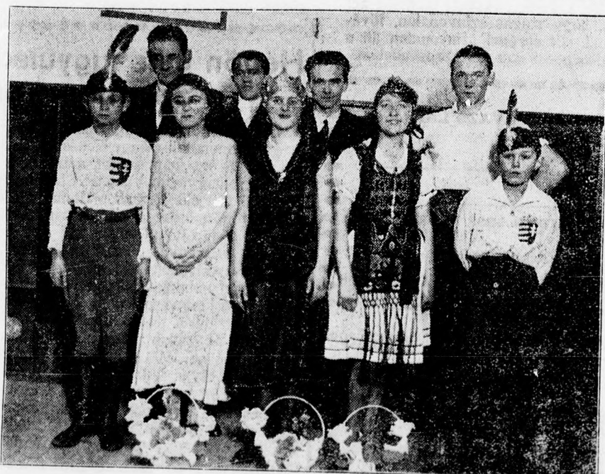
A vasárnapi levante ünnepély szereplői.