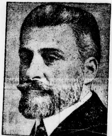
Bratianu Vintila, a román liberális párt vezetője, aki legélesebben ellenezte Károly király hazatérését, 61 éves korában meghalt.