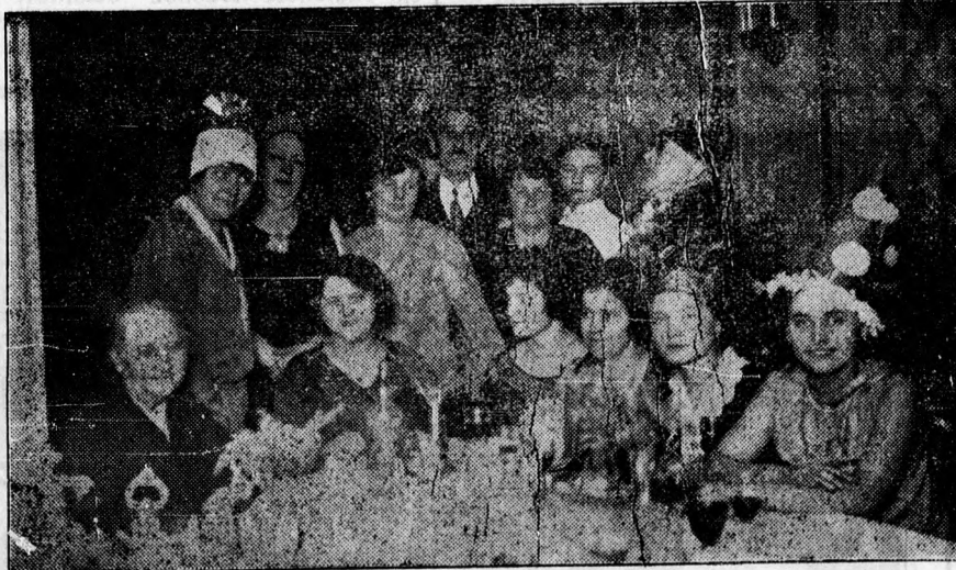
Szilveszter éjszaka az Angol Királynőben

A szavazatszedő küldöttségek elnök az 1931. évi január hó 4-én. (vasárnap) a szavazatszedő helyiségekben délel