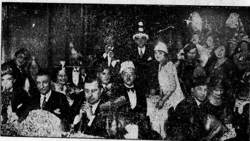
Szilveszterest az Angol Királynőben.