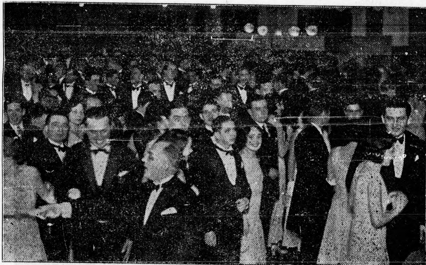
AZ OMIKE bál az Arany Bikában.