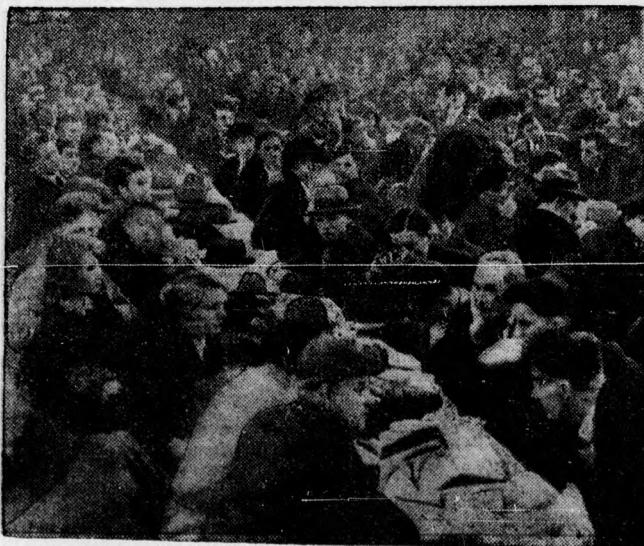
A ruhrvidéki sztrájkolók sztrájkantanyája. A Ruhrvidéken a szénbányászok sztrájkba léptek. Már több összeütközés is volt, amelyek során több munkás meghalt.

A DEBRECENI FÜGGETLEN UJSÁG. LEGJOBB HIRDETÉSI ORGANUM