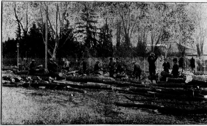
Kiirtják a Simonyi ut százéves akácfasorát. A villamosvasut sineire döntötték ki a fákat s emiatt a Simonyi uton most egyoldali villamosközlekedés van.