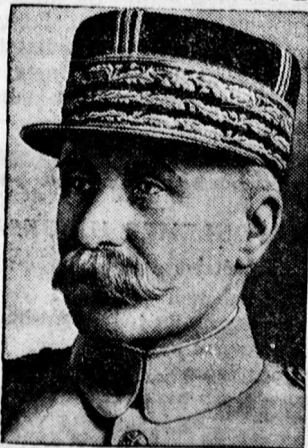
Petaín marsall, a francia legfelsőbb haditanács alelnöke, az összes francia haderők generalissimusa.

— Pálfyné Gulácsy Irén legújabb monumentális regénye: Pax vobis 3 vaskos kötetben Pengő 15.— megjelent és kapható: Hegedüs és Sándor R. T. könyvkereskedésében, Ferenc József ut 34. sz.