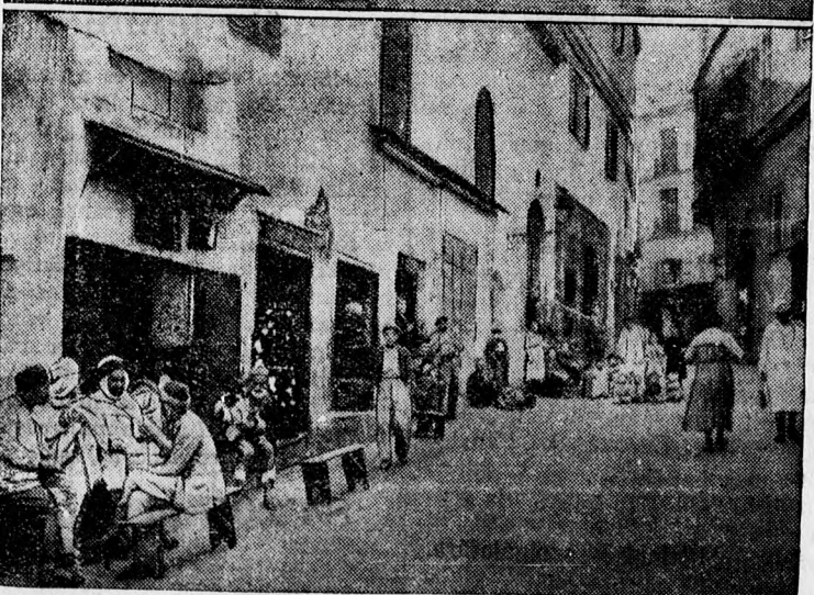
Borzalmas földcsuszamlás Algirban. Az algiri óvárosrész, ahol a földcsuszamlás történt. Az alsó képen: Belső utcák uccája, ahol két ház teljesen rommá lett és a romok betemettek egy lakodalmi ünnepre készülő társaságot. A romok 60 embert öltek meg.