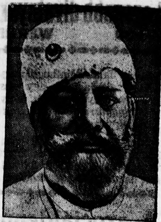
Mauhana Mohamed Ali, az óindiai mohamedánus liga megalapítója, később az első Gandhi-féle bojkottmozgalom vezetője. A kiváló indiai politikus meghalt.

Nagy élmény volt a debreceni közönség számára, hogy tökéletes előadásban hallgatta Beethoven utolsó ópusainak egyikét. Az a-moll kvartett témájánál és formamegoldásánál fogva is messze túlnőtt a vonós négyes szokványos határain és így joggal tekintik meg nem született X. szimfónia gondolatának és vázlatának megtestesítőjéül. Azok a jegyzetek, amelyekkel Beethoven ezt a művét ellátta, megkönnyítik számunkra, hogy élete végei nagy szárnyalását figyelemmel kísérjük. A-moll az a hangnem, amelyben ezt a kvartettjét komponálta, egy Beethoven által ritkán alkalmazott hangnem, a leglíraibb fájdalom kifejezője. Merőben tévesek azok a kommentárok,