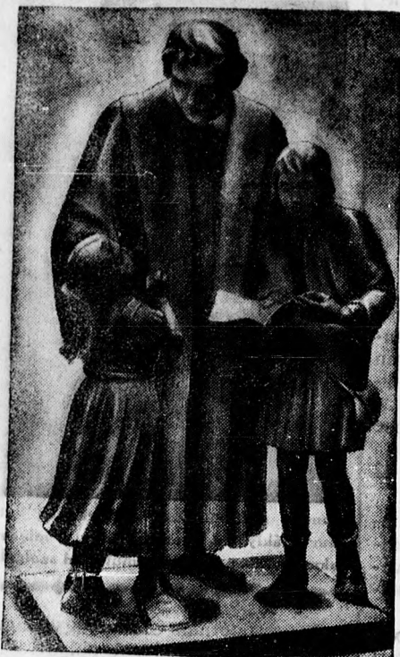
Uj Luther-szobor Berlinben.

!! Mi olcsóbbak vagyunk !! CSIPKE ÉS RÖVIDÁRU SZAKÜZLET Hatvan ucca 1. — (Püspöki palota.)