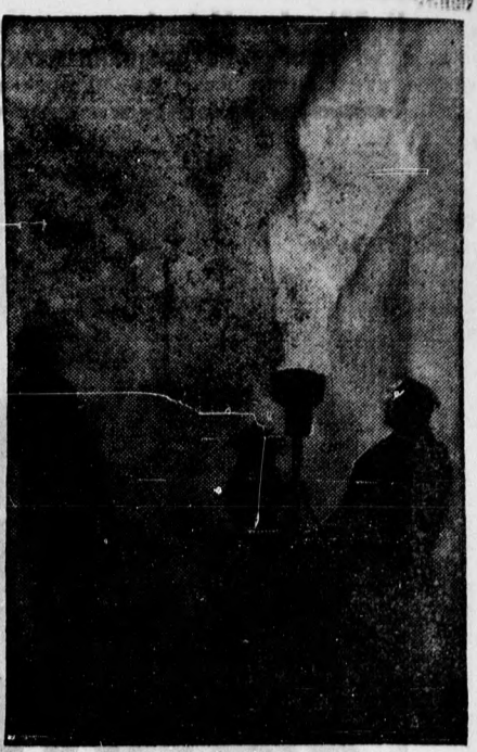
London közbén. Az uccasarkokon hatalmas szurokfájllyakat égetnek, hogy a mindent eltakaró ködben gyöngye utmutatóul szolgáljanak.