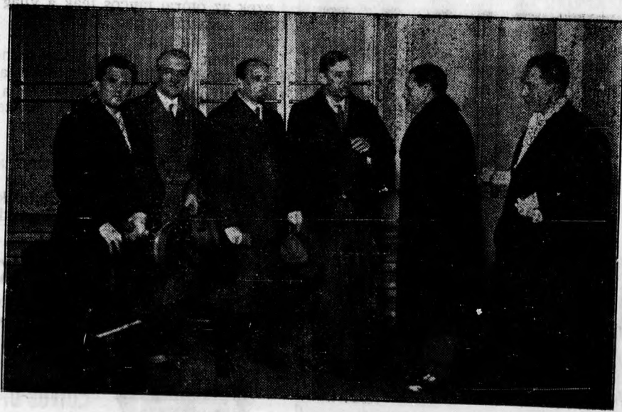
A drezdai vonós négyes Debrecenben. A Zenekedvelők Körének vezetősége fogadja a művészeket.