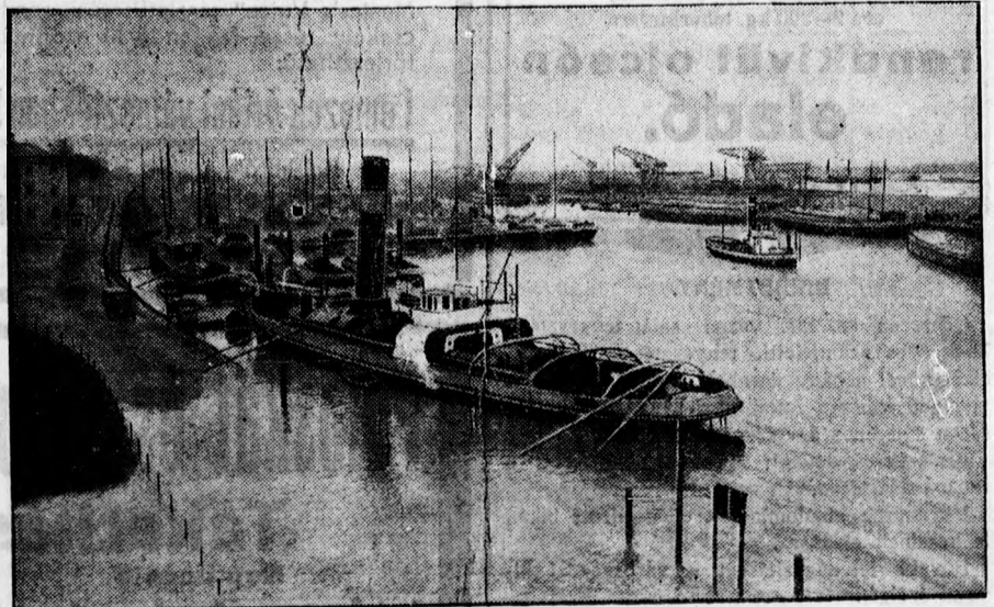
A ruhrvidéki sztrájk. A szállítóhajók flotillája elhagyottan horgonyzik a duisburgi szénbányában.

Masszázás árt a bőr üdesegének, elég, ha egy erős kefével végigdörzsöljük magunkat naponta kétszer tetőtől talpig.