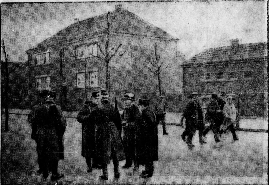
A ruhrvidéki bányászstrájk. Rendőri kirendeltség védi azokat, akik a strájkhatározat ellenére dolgozni akarnak.