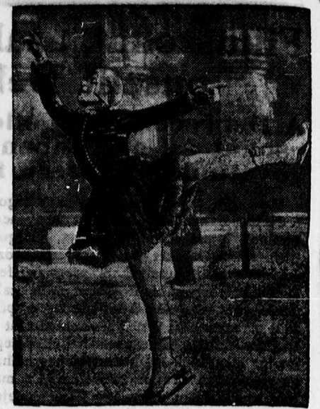
Sonje Henie, a világhírű norvég korcsolya világbajnok.

Azok, akik már megmenekültek a hamiskártyásoktól, vagy pedig közelükben élve jól látják, hogyan üzik manipulációikat, érdekes módjait tudják annak, hogy miképpen lehet a hiszékeny embereket megfosztani pénzüktől. Az egyik újabb nagyon fölkapott trükk a kártyalapoknak óvatossá meghajlítása úgy, hogy a kártyalap törést nem szenved, de az éles szem észreveszi a kártya homorú, vagy domború hajlását, amelyből következtetnek a kártyára. Ezt a módszert hosszas gyakorlattal művészi tükölyre lehet vinni és még a legügyesebb amatorkártyázó sem veszi észre a profi kártyásoknak ezt a