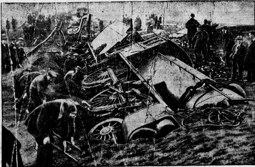
A repülő skót, a világ leggyorsabb mozdonyának katasztrófája a skót Carlisle állomás közelében. A katasztrófánál 8 ember meghalt, 50 súlyosan megsebesült.