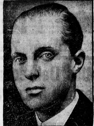
Don Alfonso, a spanyol trónörökös, aki most feleségül veszi Bourbon-Sicíliai Esperanza hercegnőt, 18 éves unokahugát.

mába mögött az antiszemizmus alattomosabb rugóit, látjuk az udvar körül zajló álcárcs intrikákat, a kormányok játékosan kicsinyes kulisszatitkait s azt a sok értetlen és méltatlan gáncsvetést, amely végül is megátolta, hogy Vázsonyi Vilmos befejezze élete nagy feladatát.