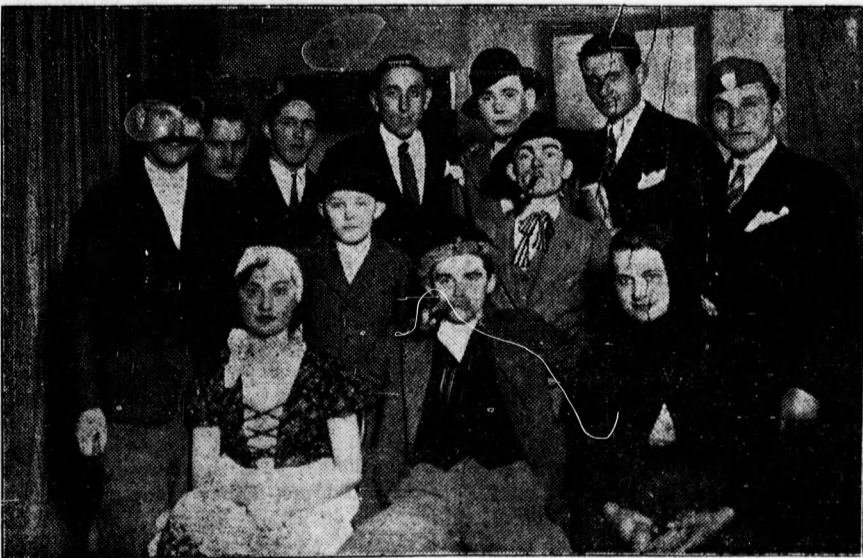
A levénte egyesület kulturstjének szereplői.