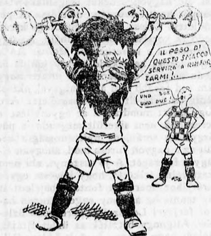
Az „Il brivido sportivo” firenzei sportlap gúnyképe a Bocskay-Fiorentina 4:0-ás mérkőzés után. A képen a firenzei oroszlan áll futballdresszben, savanyu arccal, kezében két hatalmas súlyzó négy gombja jelképezi a négy kapott gölt. Az oroszlan a háttérben álló Bocskay-dresszeses futballista „Egy-kettő, egy-kettő...” vezényszavára emelgeti a súlyzókat, a következőket mondva: „Ennek a súlyzónak az emelgetésével az erőmet gyarapítom!” A kép aláírása lelkesítő vers. Szabad fordítása: Dolgozz erősen ó oroszlan a súlyzóval és bizonyítsd be — hűséggel és büszkeséggel — [séggel] élesítve agyared és körmeid — hogy senkisésem gúnyolhat téged nyulnak.