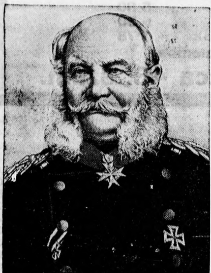
A német birodalom megalapításának hatvanadik évfordulója. A birodalom első császára, I. Vilmos.

Prima kemény KALAP P8.50 magolcsai Nagy Mihály Plac ucca 37. sz. (Kistemplom mellett)