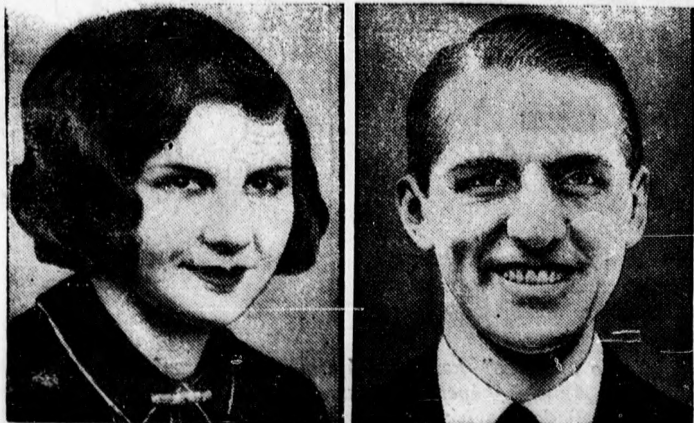
Lita Grey, Chaplin elvált felesége és George Carpentier boxoló, Dempsey volt ellenfele. A napokban, amikor kijöttek az egyik színházból, banditák elrabolták őket.

ván között. A mostani választáson több hívő érdeklődik a választás iránt, mint augusztusban. Ma ugyanis 5417 választó szavazott le, míg augusztusban a választás első napján 4570 volt a szavazók száma.