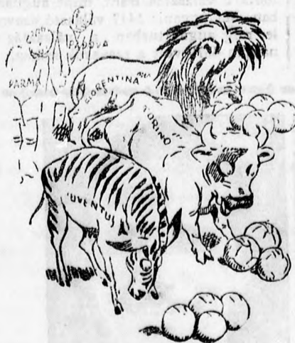
Az „Il brivido sportivo” karrikatúrája a dunai országok olasz turáinak eredményéről. Az első képen az olasz csapatok kapott góljaik mellett. — A Parma és a Padova a háttérben szegyenkezve állanak. Ez az olasz gólimport. A második képen a vendégeknak adott gólokat viszik büszkén az olasz egyesületek. „Emléklül” ott viszi a Bocskay elé a gyíkfejű Ambrosiana is a mi kapunkba rugott 7 gölt.

Itt adjuk a cikk szemelvényeit. ... A Fiorentina a bajnokságban elért eredményeinek ellenpróbájával kötött le mérkőzést a kitűnő magyar csapattal, a Bocskayval — sajnos, ez a próba rosszabbul nem is sikerülhetett volna.” (Itt a lap erősen kritizálja a Fioren-