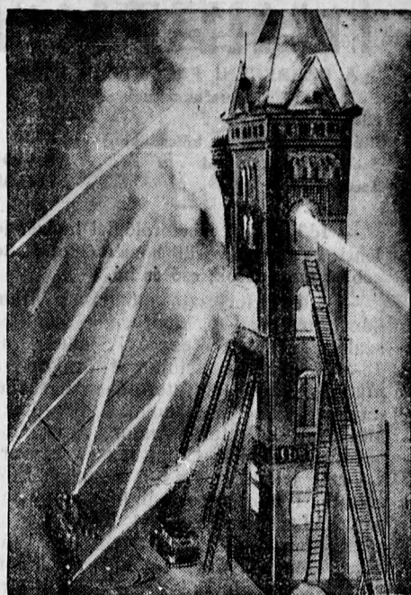
A „Baltimor Post” ujságpalotájának égése.