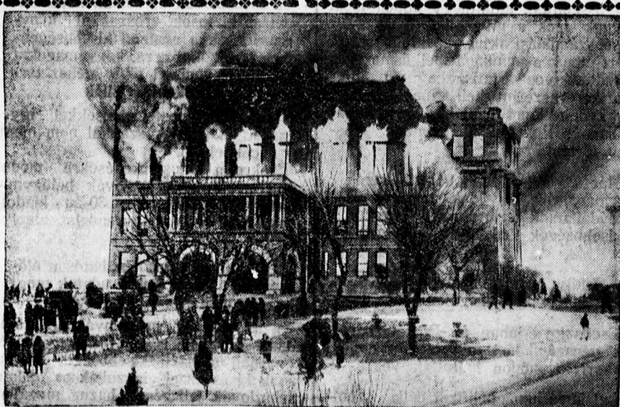
Az északdakotai kormányzósági palota, a Bismarck capitol.

Az adóbevallásokat megelőzően a pénzügyminiszter körrendeletet szokott kibocsátani a pénzügyigazgatóságokhoz, illetően a kerületi adófelügyelőségekhez és adóhivatalokhoz. A körrendeletben fontos és nagyjelentőségű utasításokat ad a jövedelem- és vagyonadó ki-