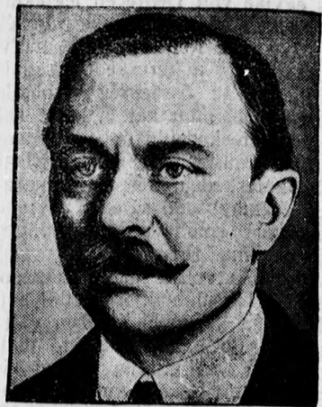
Gróf Zamviszky, Bourbon Izabella spanyol hercegnő férje, állítólag Lengyelországban, kastélyában mindent előkészített, hogy XIII. Alfonz detronizálása esetén a spanyol királyi családot ott elhelyezze.

A városi ingatlanok és a községi belsőségek értékelésére tartalmaz utasításokat a rendelet, utal arra, hogy az ipari üzleteknél általában az üzleti jövedelemnek husz százalékától annak ötszöröséig, a kereskedelmi üzleteknél az üzleti jövedelemnek egy-ötzöröséig terjedő összegben kell felvenni az üzemi tőke értékét. A vegyes rendelkezésekben a pénzügyminiszter