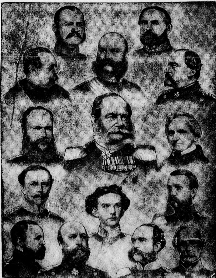
A hatvanéves német birodalom jubileuma. Németország uralkodó fejedelmei 1871-ben. 1. sor: A szász-altenburgi herceg. A braunschweigi herceg. 2. sor: A hesseni nagyherceg. A szászmeiningeni herceg. A szász-coburg-gothai herceg. 3. sor: A württembergi király. Vilmos porosz király, a későbbi császár. A szász király. 4. sor: A szász-weimari nagyherceg. Lajos bajor király. A badeni nagyherceg. 5. sor: Az oldenburgi nagyherceg. A mecklenburg-schwerini nagyherceg. A mecklenburg-strelitzi nagyherceg. Az anhalti nagyherceg.

Kaphatók: HEGEDUS ÉS SÁNDOR R. T. gramofonosztályában, Piac uca 34.