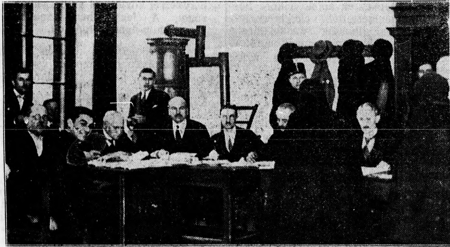
A debreceni lelkészválasztás. — Folyik a szavazás a Péterfia uccai egyházzs ezavazóhelyiségében.