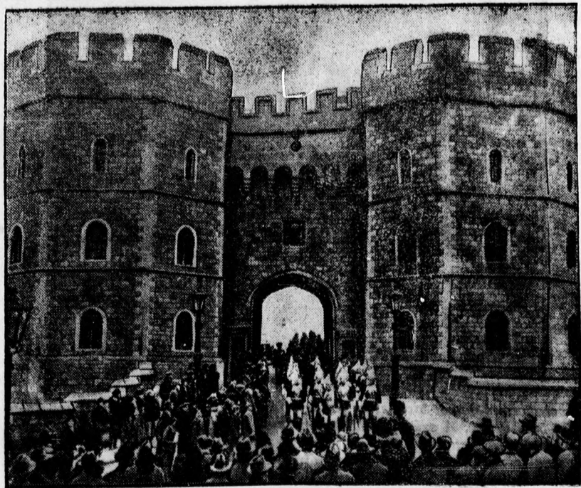
A windsori királyi kastély kapuja. Az őrség Viktoria Luise hercegnő temetése után elhagyja a kastélyt.