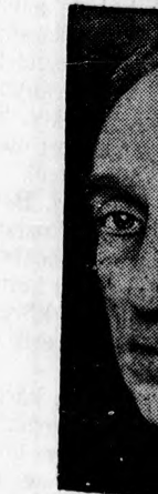
India volt alkirá vezér, lo

Békés Laj terjedt az eg azzal a mély letődéssel fo tiszta nemes Temetése pé lesz a Keres