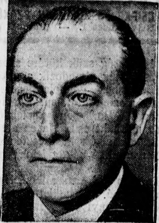
Curtius, a német külügyminiszter, az összeülő népszövetségi tanács egyik legjelentősebb tagja.

Az előadással kapcsolatosan egész Európára szóló propagandát szándékoznak kifejtetni, még pedig az Ibuszal karöltve, külföldön a MAV hivatalos kép-