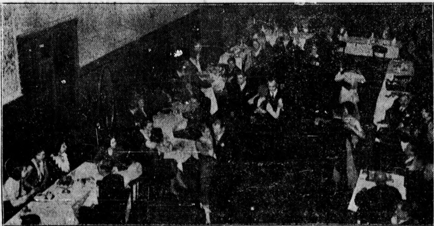
Felvétel az Ujságíró Club vasárnapi táncos teadélutánjáról.

olasz szerzőket egyaránt, akinek — utazás nélkül mondhatjuk — ma az egész világ zenei közönsége a lábai előtt fekszik. A debreceni közönség előtt sem ismeretlen a neve, hiszen van-e valaki, aki nem hallotta volna a rádió gramofonhangversenyén az ő csodálatos énekét, a szebbnél szebb lemezeket, amelyek hirdetik, hogy ismét megszületett a koloratúraének fejedelme... Nagy áldozatába került a Zenekedvelők Körének, hogy Guglielmetti, aki világtornéja során e hó 20-án énekel Budapesten, Debrecen részére leküsse s ez annál nehezebb volt, mert a világhírű művésznő Budapestről egyenesen Konstantinápolyba utazik, onnan ismét Párisba és két elég távoli pont között énekel január 29-én Prágában, 31-én pedig Debrecenben. A Zenekedvelők Köre azonban szívesen meghozta ezt az áldozatot, mert különös nagy súlyt helyez arra,