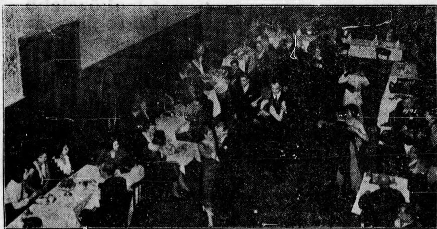
Felvétel az Ujságíró Club vasárnapi táncos teadélutánjáról.

olasz szerzőket egyaránt, akinek — túlzás nélkül mondhatjuk — ma az egész világ zenei közönsége a lábai előtt fekszik. A debreceni közönség előtt sem ismeretlen a neve, hiszen van-e valaki, aki nem hallotta volna a rádió gramofonhangversenyein az ő csodálatos éneket, a szebbnél szebb lemezeket, amelyek hirdetik, hogy ismét megszületett a koloratúraének fejedelme... Nagy áldozatába került a Zenekedvelők Körenek, hogy Guglielmetti, aki világtűrnéja során e hó 20-án énekel Budapesten, Debrecen részére leküsse s ez annál nehezebb volt, mert a világhíri művésznő Budapestről egyenesen Konstantinápolyba utazik, onnan ismét Párisba és e két elég távoli pont között énekel január 29-én Prágában, 31-én pedig Debrecenben. A Zenekedvelők Köre azonban szívesen meghozta ezt az áldozatot, mert különös nagy sulyt helyez arra,