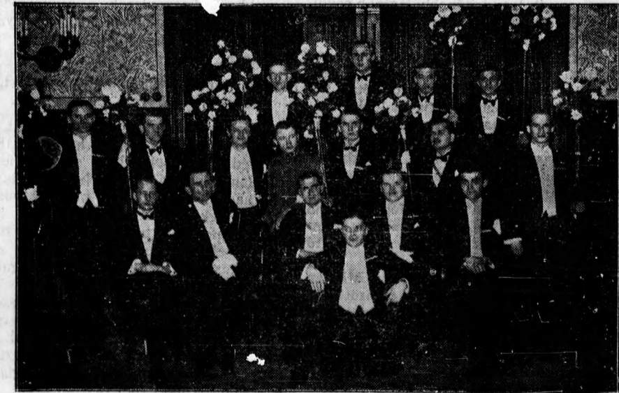
A debreceni jogászbál. A rendező gárda.