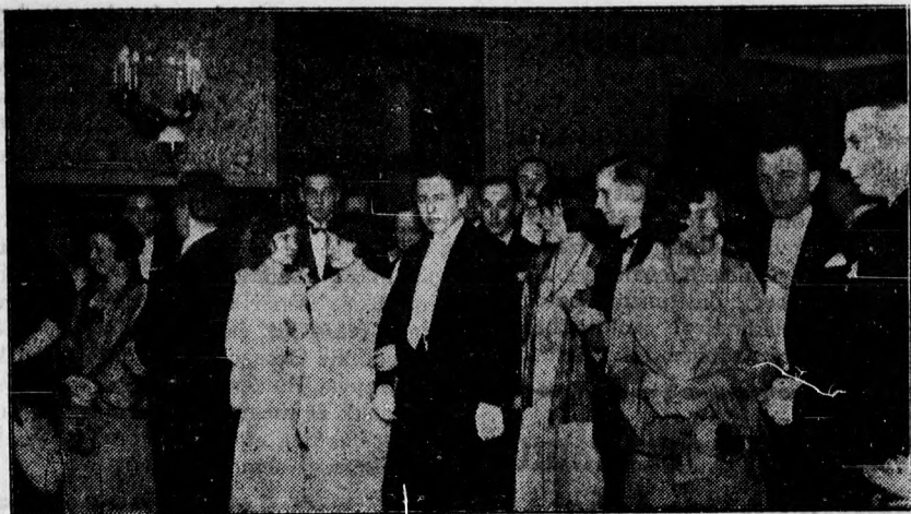
A debreceni jogászbál. A résztvevők egy csoportja.

LEGJOBB HIRDETÉSI ORGANUM A DEBRECENI FÜGGETLEN ÚJSÁG