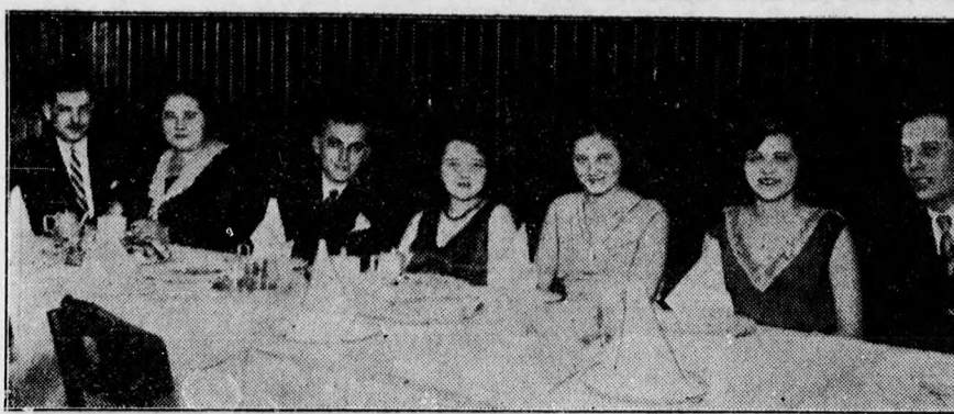
Az Ujságíró Club vasárnapi teadélutánjáról. Az asztal közepén Miss Debrecen és két udvarhölgye.

Elek Péter butorraktárában Hatvan ucca 64