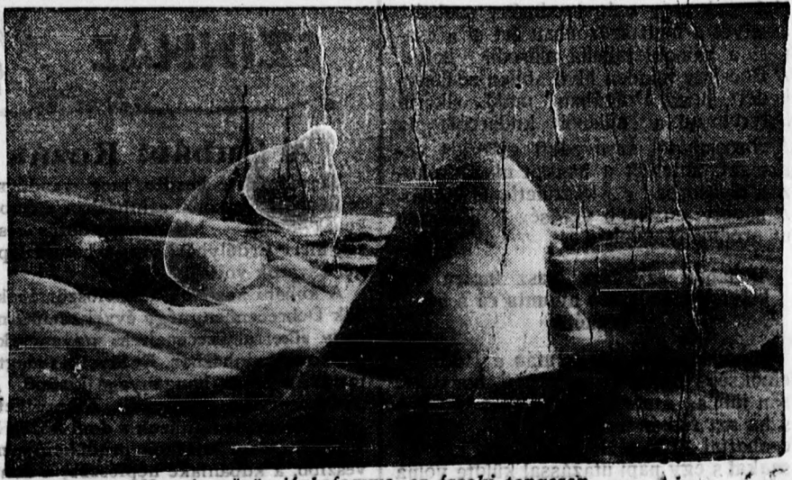
Norvég gőzös jégbefagyva az északi tengeren.