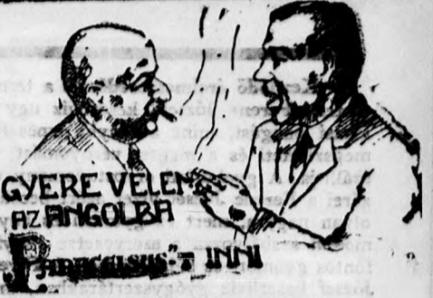
GYERE VELEN AZ ANGOLBA

vezetője közhírré teszem, hogy a „Debreceni Vadászterület” Debrecen sz. kir. város határára békelt vadászterületén és pedig 1. Lóversenyterén. 2. Monostori erdőben. 3. Nagyerdőn. 4. Apafája erdőn. 5. Nagyerdei erdőszélén és környékén. 6. Szótán. 7. Nagycseri erdőszélén laknál és környékén. 8. Somjai erdői laknál és környékén. 9. Haláplaki erdői laknál és környékén. 10. Hármashelyi erdői laknál és környékén. 11. Halápi erdői laknál és környékén. 12. Halápi erdői laknál és környékén. 13. Kanálhegyi erdői laknál és környékén. 14. Régi bányai erdői laknál és környékén. 15. Mézeshegyi erdői laknál és környékén. 16. Felsőpaci erdői laknál és környékén. 17. Alsópaci erdői laknál és környékén. 18. Ohatj erdőn. 19. Savósguti erdőn 1931. évi január hó 1-től, 1931. évi december hó 31-ig terjedő időre kártékony és ragadozó állatoknak méreg (phosphoricum és strichinum) által való pusztítására — a m. kir. Belügyminiszter urnak 23.542-1925. és 16.086-1900. sz. rendeletei alapján — hatósági engedély megadását kéri. Erről a felsorolt területeken és azok szomszédságában levő összes birtokosokat, az érdekelteket egész lakosságot, valamint a mérgezési területtel határos községek elöljáróságát azzal értesítem, hogy a kérelemre nézve a közzétételtől számított 8 nap alatt — a hivatkozott belügyminiszteri rendeletek értelmében — a m. kir. állami rendőrség debreceni kapitányságánál nyilatkozhatnak, Súly vezetője.