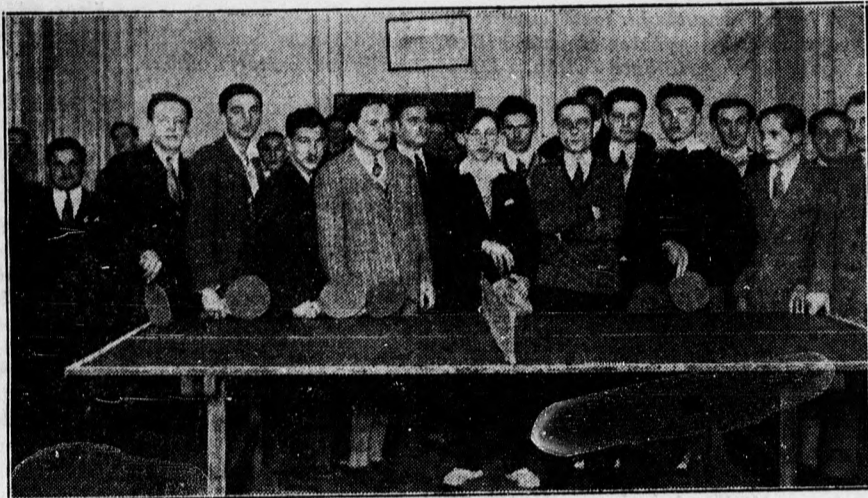
A Magántisztviselők és a KIE asztali teniszversenyének résztvevői.