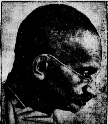
Mahatma Gandhi, a hindu nemzeti mozgalom vezére, akit India alkirálya most bocsátott szabadon börtönéből.

Bécs. 11: Gramofon. 3.25: Hangverseny. 5: Asszonyok órája. 7.30: Felolvasás. 8: Aria-