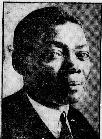
Néger a francia kormányban. Diagne, a Laval kormány gyarmatiügyi államtitkára.

Páris, január 30. A képviselőház a Laval kormánynak 312 szavazattal 255 ellenében bizalmat szavazott.