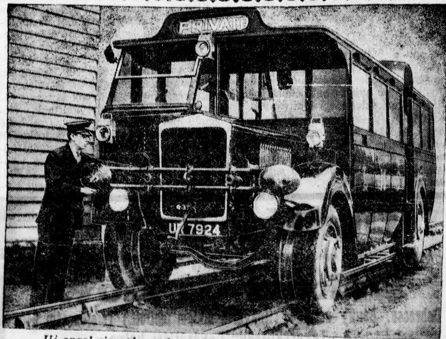
Uj angol sinautó, amelyet a jövő közlekedési eszközeinek tartanak.