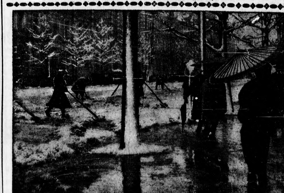
A föld tulsó oldalán is úgy van, mint nálunk. — Olvadó hó Tokió uccán.

Guglielmotti hangversenyt. A világhírű olasz énekesnőt tegnap Budapesten huszonhét tapsolták a lámpák elé. A debreceni február 8-iki hangverseny iránt az érdeklődés már is oly nagy, hogy a nagyszámu előjegyzésekre tekintettel a rendezőség pódiumjegyek kibocsátását határozta el. Jegyek Méliusznál és az Arany Bikánál.