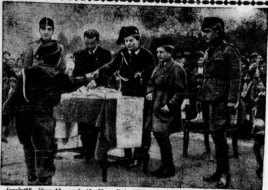
A fasiszták jövő vezetői? Mussolini Viktor és Mussolini Bruno, a Duce kis fiait tevékeny részt vesznek az ifjú fasiszták vezetésében.

A közönség, értékelve a tehetséges fiatalok munkásságát, végig tapsolta a műsört.