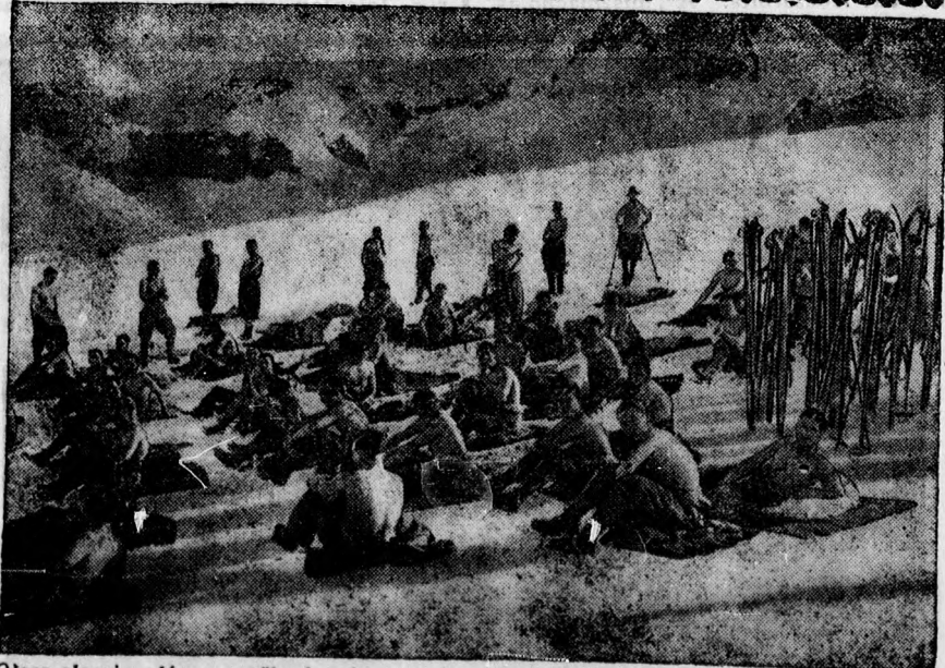
Olasz alpesi vadász mentőlegénység meztelen felsőtesttel sütkérezik a napon a hóban. Az olasz-francia határon katonai sikatasztrófához küldték ki a csapatot. Eddig 21 halottat talált meg a mentőlegénység.

Már az is gyanús volt, hogy Erdélyi elhallgatta a biztosítást, különösen azonban az bizonyít ellene nagy mértékben, hogy négyezer pengős biztosítási