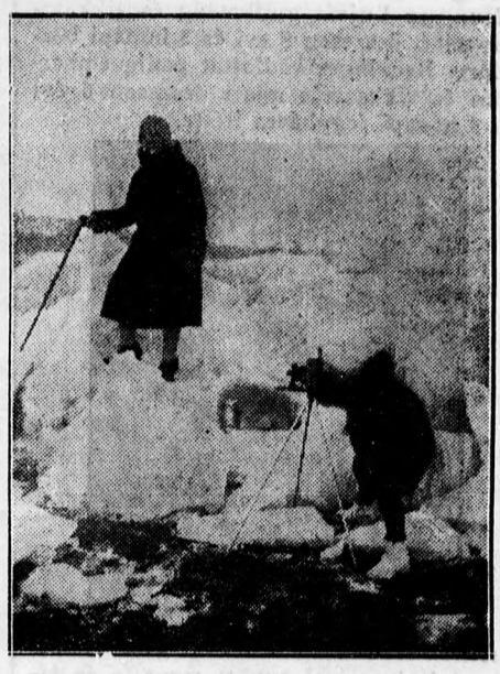
Benn a városban el sem hiszik, hogy a külsőségen még sárban uszó jéghegyeken mászkálnak az emberek.

kézilőfegyvernek. Magyarország céllovő bajnoki címét három ízben nyerte el s külföldi versenyeken is diadaldiadalra halmozott.