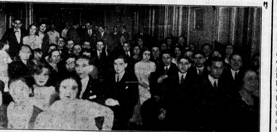
A Kereskedők és Utazók Egyesülete szombaton szépen sikerült családi estélyt rendezett saját klubhelyiségében. A kép a közönség egy csoportját mutatja.

A félig már kiépített mátai strandot az előterjesztés szerint háromszorosára kellene bővíteni. Vetkőző kabinokul pedig öblös alju vasalókat, nádból készült kumyhókat kell létesíteni, hogy ezek is hozzájáruljanak a pusztai környezetnek. A fürdőtelep kiépítésével kapcsolatban gondoskodni kellene a mátai telep rendbe