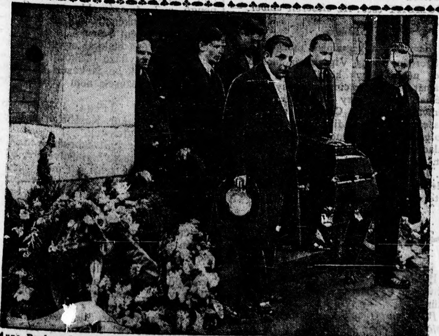
Anna Pavlova koporsóját orosz előkelőségek viszik a hágai kórházból a vasutra, hogy onnan Londonba szállítsák.

— Szakosztályi ülések. A debreceni ipartestület férfiszabó, sapkakészítő, szűrszabó, gubás szakosztálya e hó 6-án, pénteken este hét órai kezdettel tartja az ipartestület kistanácsstermében tisztújító ülését. Tárgy: 2 előjárósági rendes és 2 póttag jelölése. Az ülés rendkívül fontos voltára tekintettel, a tagok teljesszámú és feltétlen megjelenését ezuton kéri a szakosztály elnöksége. Amennyiben ezen ülés határozatképtelen lenne, a következő ülés e hó 10-én, kedden este 7 órakor fog megtartatni, amely ülés, a megjelenő tagok számára való tekintet nélkül, határozatképes lesz. — A kófaragók, szobrászok működésük szakszervezete e hó 6-án, pénteken délután négy órakor tartja az ipartestület kistanácsstermében tisztújító ülését. Tárgy: 1 előjárósági rendes és 1 póttag jelölése. Fenti ülésre a szakosztály tagjai azon figyelemzettel hivatnak meg, hogy amennyiben ezen ülés határozatképtelen lenne, a következő ülés — a megjelenő tagok számára való tekintet nélkül — határozatképes lesz. Szakosztály elnöksége.