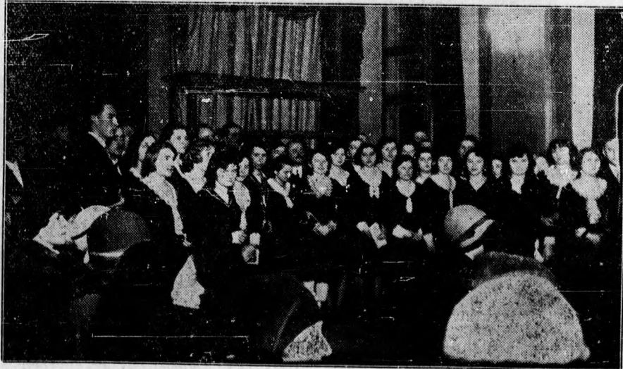
A MANSz Erzsébet vegyeskar szép sikerrel működött közre a Szülők Iskolájának keddi előadásán.

Hentesmesterek figyelmébe. A hentes szakosztály e hó 19-én, azaz ma este fél 8 órakor az ipartestületben ülést tart. Tárgy: adóelőleg fizetése; sertések bélyegzése; védjegy kérdés és indítványok. Tekintettel a tárgysorozat szereplő igen fontos ügyekre, a szakosztály tagjainak teljes számu és pontos megjelenését ezuton kéri a szakosztály elnöksége.