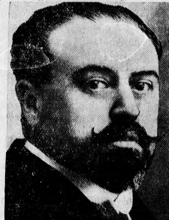
Santiago Alba volt belügyminiszter, akit a spanyol király miniszterelnökké designált, de kormányalakítása a köztársasági és szocialista politikusok ellenállásán meghiusult.

csupán az alkotmány egyes cikkeinek módosítására, hanem jogában állna, hogy az egész alkotmányt reformálják