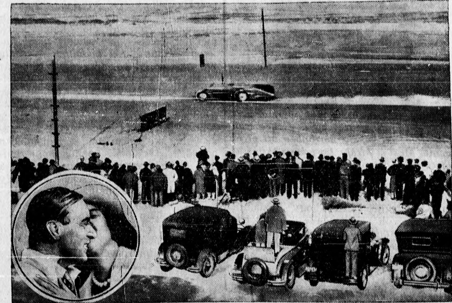
A legelső fényképfelvétel Campbell új világrekordjáról. — Campbell őrnagy a daytoni tengerparton új gépével (felső képen látható verseny közben) új világrekordot állított fel, miután óránként 395 km. sebességet ért el. Az alsó kép azt a jelenetet ábrázolja, amikor Campbellné a sikeres rekordkísérelt után túlradó örömben megcsókolja a férjét.