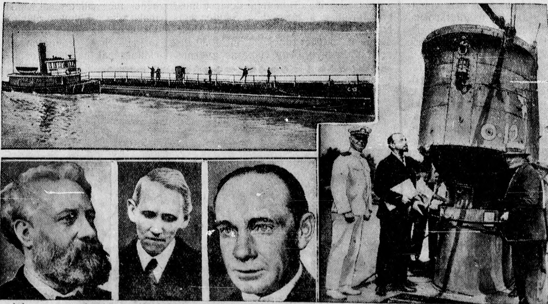
Wilkins kapitány tengeralatti expedíciója utrakészen áll az Északi Sark elérését — tengeraltattjárón. Felső kép: Wilkins tengeraltattjárója, a Nautilus. Alól balra: Verne Gyula, a világhírű francia író, aki négy évtizeddel ezelőtt egy utópisztikus regényében megjövendölte a tengeralatti sarkutazást. Középen: Verne Gyula unokaöccse, aki résztvesz az expedícióban. Jobboldalt alól: Wilkins kapitány, a haláltmegvető bátorsága sarkutazók vezetője. Jobb oldali kép: Wilkins kapitány és utitársai a Nautilus parancsnoki hidja előtt.

LEGJOBB HIRDETÉSI ORGANUM A DEBRECENI FUGGETLEN UJSÁG.