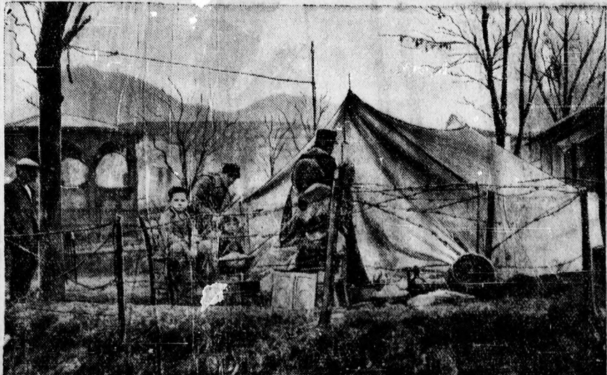
Kép az albán földrengésről. A lakosság legnagyobb része sátrokban a szabadban lakik.