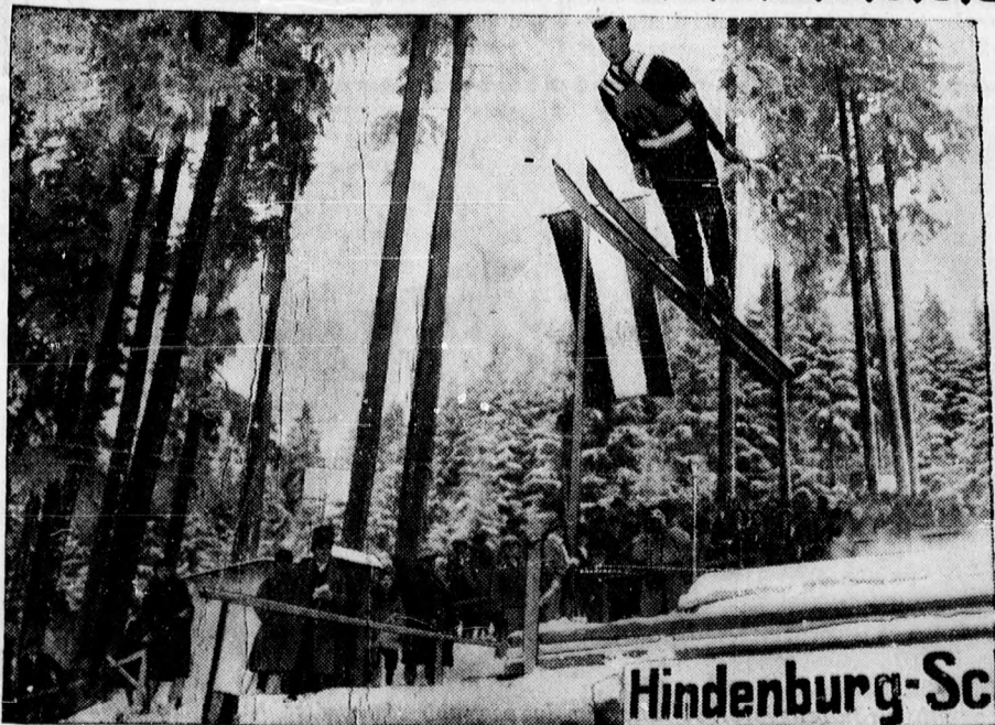
Németországi nemzetközi síugróverseny győztese egy 19 éves norvég diák, Birger Ruud, aki 58 és fél méter magas sánccról ugrott le hibátlanul.

Érdeklődni lehet Weinstock butorúzetében, Miklós ucca 2.