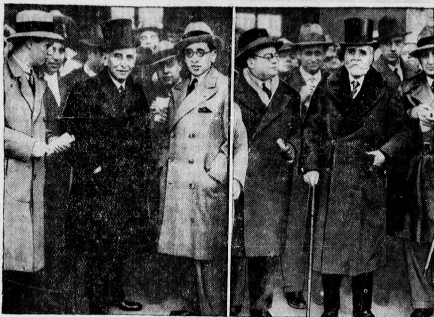
A spanyol válság. Baloldalon: Melquíades Alvarez a XIII. Alfonzzal folytatott megbeszélés után elhagyja a királyi palotát s interjút ad az újságíróknak. — Jobboldalon: Sanchez Guerra, volt dézig nált miniszterelnök tájékoztatja a sajtót a helyzetről.

könyvkereskedésében Ferenc József ut. 34.