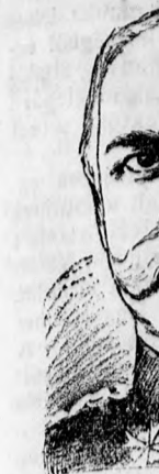
Gróf Caprivi egyik megtere Most ünneplik