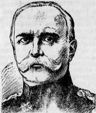
Gróf Caprivi Leo, a hármasszövetség egyik megteremtője, Bismarck utóda. — Most ünneplik születésének századik évfordulóját.