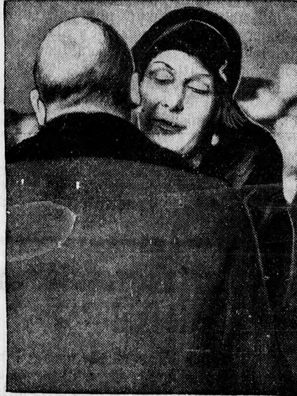
Az Angliából Spanyolországba visszatérő spanyol királyné bucsuzik György angol királytól.

A pert az elfogott politikusok ellen minden körülmények között le fogják folytatni a legfelsőbb haditörvényszék előtt, még pedig a cortez összeülése előtt. A baloldali pártok által követelt garanciákat pedig előreláthatóan csak a községi választások előtt néhány nappal fogják közzétenni s a sajtócenzurát is ugyanakkor fogják megszüntetni.