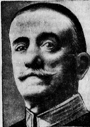
Aznar tengernagy, a konzervatívokból és liberálisokból alakult koncentrációs spanyol kormány elnöke.

Madrid, február 20. Politikai körökben elterjedt hírek szerint a kormányprogram megállapítása körül a csü-törtöki minisztertanácson heves vita