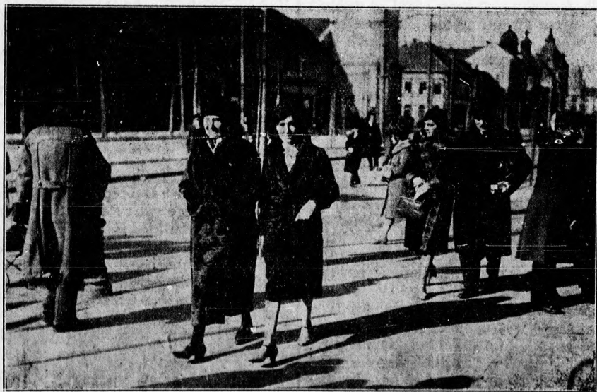
Sütkérezés a déli korzón.