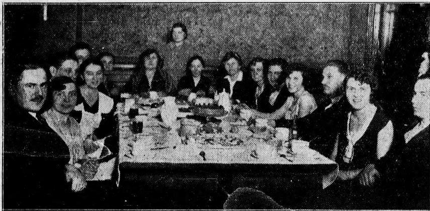
A Péterfia uccai egyházzrész leány köre összejövetelének közönsége.