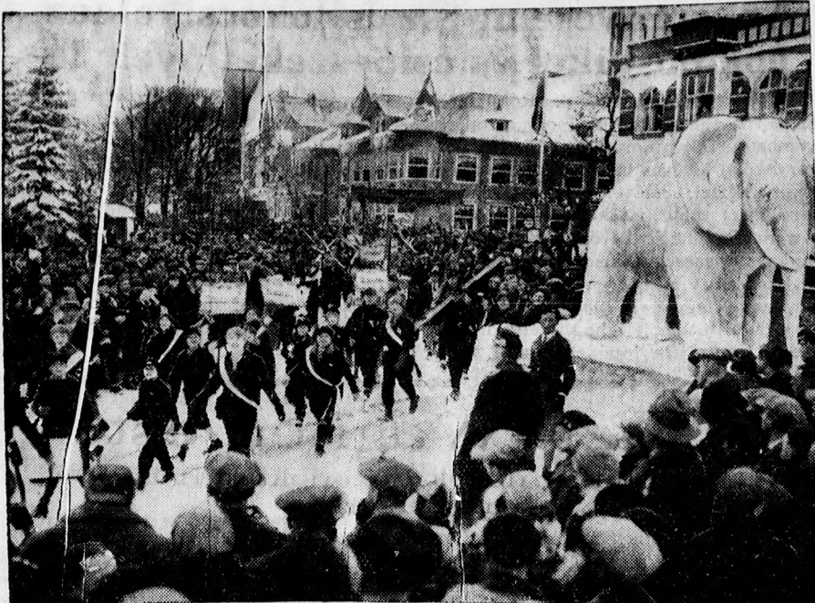
Az oberhofi nemzetközi siverseny résztvevői csoportosan indulnak a starthelyre. Jobbról egy hóból gyurt elefántsobor látható.