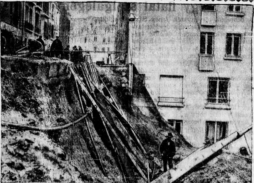
Földcsuszamlás Párisban. Páris egyik utcáján egy szerencsére üressen álló ház alatt földcsuszamlás történt. A ház összeomlott és megrongálta a szomszédos házakat is.

A mozgószínházban rendezett hangos tüntetéssel azonban nem zártak le a botrányos jelenetek, hanem