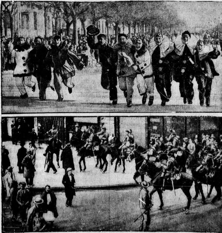
A két Spanyolország. — Fenn: Alarcos farsangi mulatozók vig csoportja Madrid uccáin. Lenn: Összeütközés ugyancsak Madrid uccáin köztársasági tüntetők és a rendőrség közt.