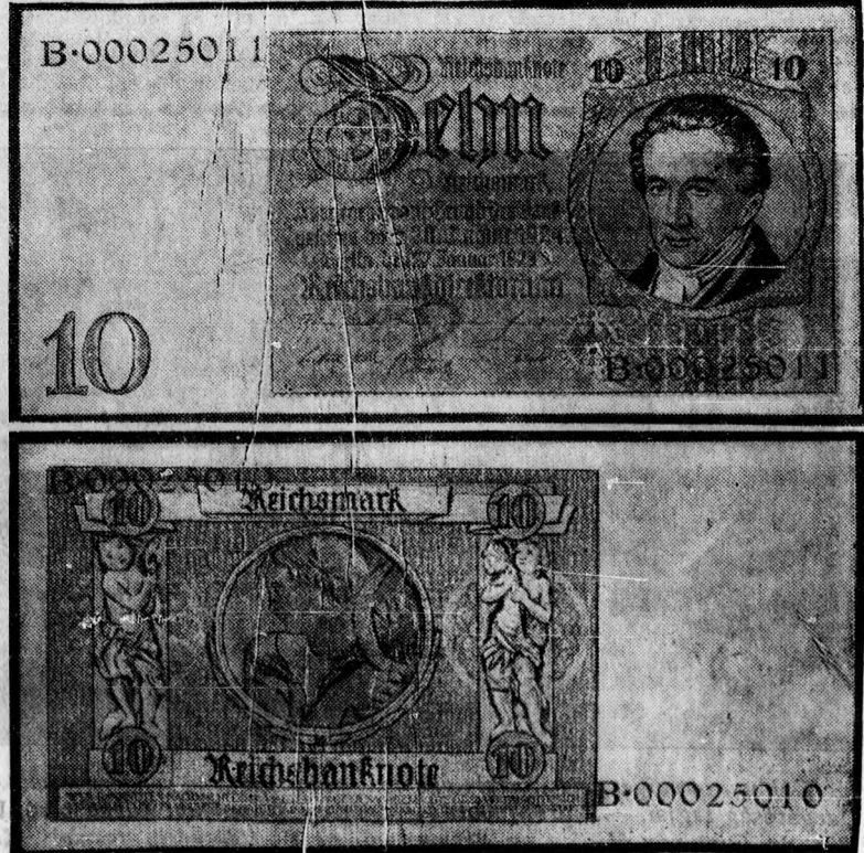
A német birodalmi bank új tizmárkás bankjegyei.

Egész délután és este keresték őket a városban és csendőriőrök a határban, de a két megszökött rabot nem sikerült elfogni.