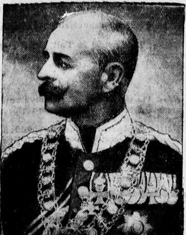
Frigyes Agost, az utolsó oldenburgi uralkodó nagyherceg most 80 éves korában meghalt.

--- P 10-16-ig --- P 8-10-ig --- P 24-40-ig --- P 20-24-ig --- P 15-18-ig