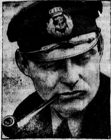
Riesser Larsen norvég pilóta, aki most jelentette a norvég külügyminiszternek, hogy az Antarktisz ártrepülésekor új földet fedezett föl, amelyre norvég lobogót dobott le és Raguhilda hercegnő földnek nevezte el.

...ngrott. An...őrbajnoka, míg...bb epeé vívója