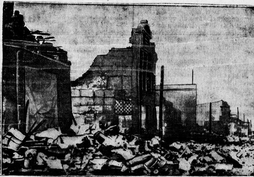
Az első hiteles felvétel az ujjeländi borzalmas földrengésről. A fenti képen látható Ujjeländ fővárosának, Napiernek, egy romokban heverő uccosora. A szilárd építésű házak ezrei úgy omlottak össze, mint a gyermekek érin- tésétől a kártyavár.