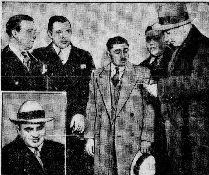
Al Capone, a csikágói banditavezér (lenn a balsarokban) pénztárnokát adóeltitkolásért letartóztatják. Al Capone ellen már sokszor kísérelték meg az eljárást, de sohasem sikerült elítéltetni.

A kisdíák szülei és testvérei csak később jöttek rá az öngyilkosságra s mikor nővérei rémülten rohantak be a szobába, a kisfiú így rimázkodott: