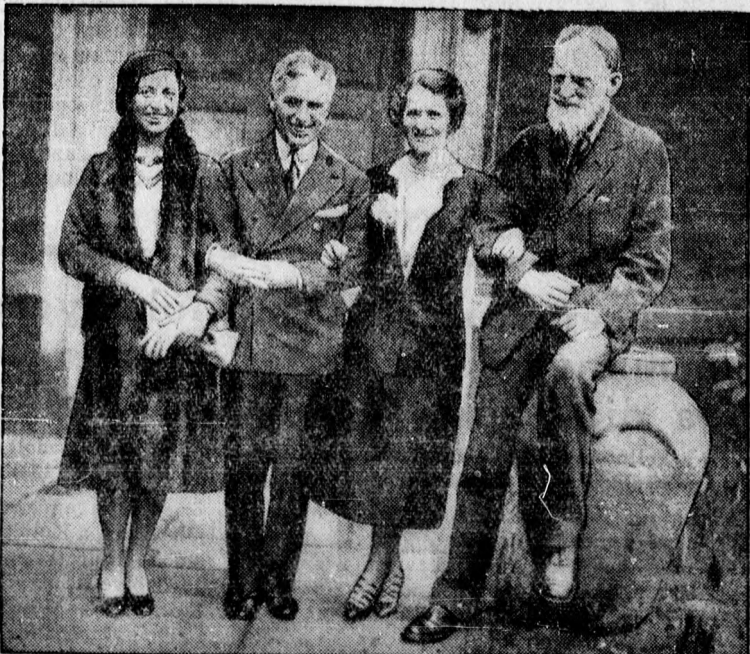
Világnevezetességek egy sorban. Balról jobbra: Amy Johnson, az ausztráliai repülőnő, Charlie Chaplin, Lady Astor és Bernard Shaw.