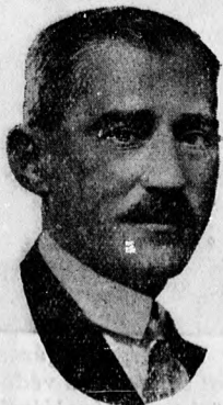
Dr. Vásáry István.

Vásáry István dr. polgármester, mint a Debreceni Független Ujság már jelezte, nagy- szabásu tervet szándékozik a közigazgatási bi- zottság elé terjeszteni. Ez a terv, amit a polgármester a héten átadott Scitovszky Béla belügyminiszter- nek is, éppen nem lo- kális jelentőségű, ha- nem az egész orszá- ra kihat, mert hiszen nem kevesebbről van szó, mint a magyar városok egyik leg- égetőbb problémájá- nak, a külvárosoknak a rendezéséről, még pedig országos vi- szonylatban. Vásáry