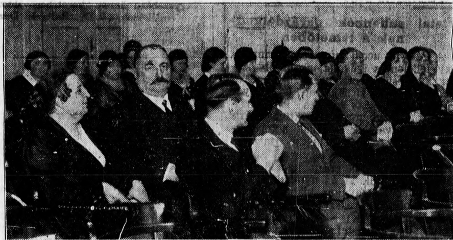
A Tiszántuli Szépmíves Céh bemutatkozó előadásán megjelent közönség egy része.

A társaság a legjobb hangulatban közel 11 óráig maradt együtt.