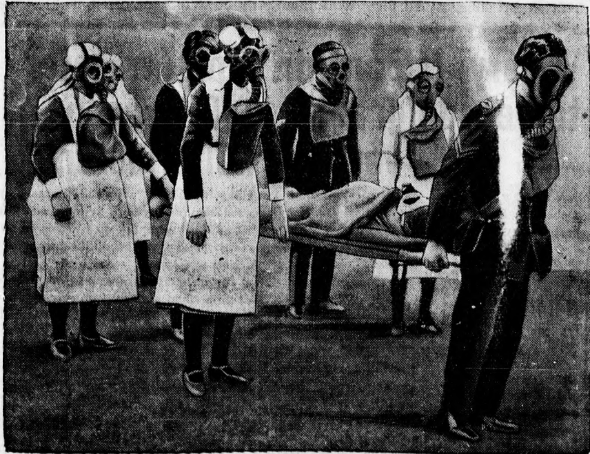
Anguában felnek az elkövetkezendő háborútól, amely a mergező gázok jegyében fog lezajlani. A hadvezetőség az egész lakosságot felszereli a védekező harcra gázmaszkokkal. A fenti képen az angol vöröskereszt ápolóinak egy osztaga látható, amint gázmaszkokkal gyakorlatoznak.

Ezen a külterületté válandó részen lévő lakóházak, amennyiben a legszükségesebb egész-