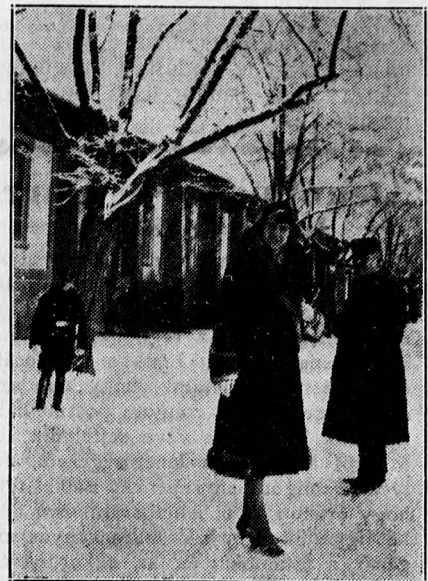
Márciusi hó. Tegnap hirtelen lehült a levegő és estefelé megindult a hóesés. Képünk a kisállomás környékét mutatja.

Te tekintse meg 90 filléres kirakatainkat, csodálkozni fog! CSIPKE ÉS RÖVIDÁRU SZAKÜZLET Hatvan-u. 1. Püspöki palota.