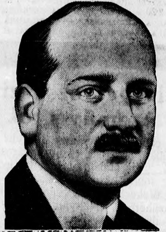
Ujabb panamabotrány Franciaországban. A legújabb megvesztegetési botrány sulyos hely- zetbe került főszereplője: Flandin francia pénzügyminiszter.

a kormány jelenleg nem foglalko- zik ezzel a kérdéssel.