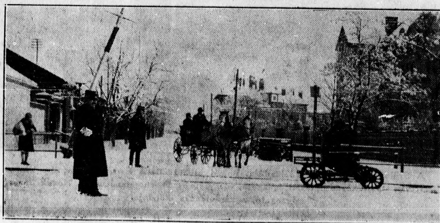
Ujra tél lett. A Széchenyi úti vasúti átjáró.

Az idevágó hatalmas statisztikai anyag kimerítése mellett ismertette Stolp professzor azt a kiváló módszert is, amellyel a kormányzat a termelők egyéni kezdeményezését megnyerni igyekezett, amennyiben 8 millió lira értékű pályadíjat tü-