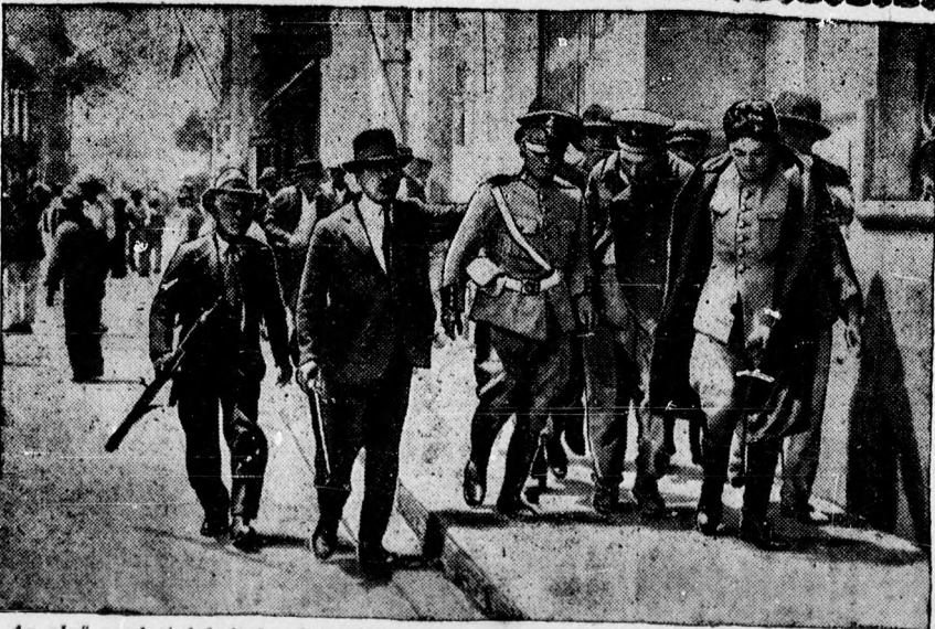
Az első eredeti felvétel a legutóbbi perui zavargásokról. Peru a földkerekség legnyugtalanabb országa, a forradalmak szinte egymást érik. Az elmúlt héten öt alkalommal kergették el a lázadó katonák a kormányt, amely azonban hatodszor is győzedelmeskedett a forradalmárok felett. A fenti képen kormányhű civilek láthatók, akik néhány lázadásban résztvevő katonát lefegyverezve kísérik a hadbíróóság épületébe.

Azonban néhány levente, aki a fiatal lányoknak udvarolt, megsejtette, hogy mi történik a pincében. Odamentek és