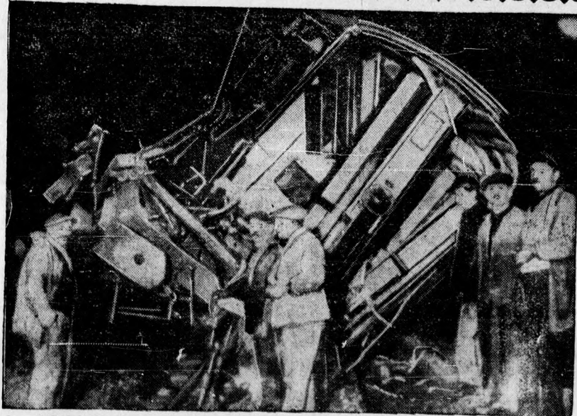
Az első képtávirat a borzalmas Etampes-i vasuti katasztrófáról. A légujabb franciországi vasuti katasztrófának tizenhat halottja és harmincnegyzet sebesültje van.

Budán egy kis borbélymesternél kopaszra nyíratam a fejemet, nehogy a hajamról felismerjenek. Ha ma a Teleky téren nem ismernek fel, akkor a maradvék ruhák eladásából szerzett pénzből