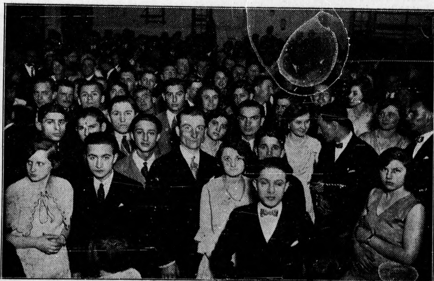
A nőipariskola sikerült multságának közönsége.

— Katonakoromban történt velem — mondja —, a legveszedelmesebb pergőtűzben egy olyan szerencsés véletlen, amelyben az a legkülönösebb, hogy az életemet egy sorsjegynek köszönhettem. Ugyanis egész életemben nagy sorsjegyvásárló voltam, annak ellenére, hogy még sohasem nyertem. Akkor a fronton voltunk rajvonalban, kartácsok és gépfegyverek pergőtűzében s egy alkalommal egyéb híján elővettem sorsjegyemet és azt mutogattam bajtársaimnak. Körém sereglettek, amikor mutattam nekik, de a papiros hirtelen kiesett a kezemből. Lehajoltam, hogy felvegyem és abban a pillanatban a