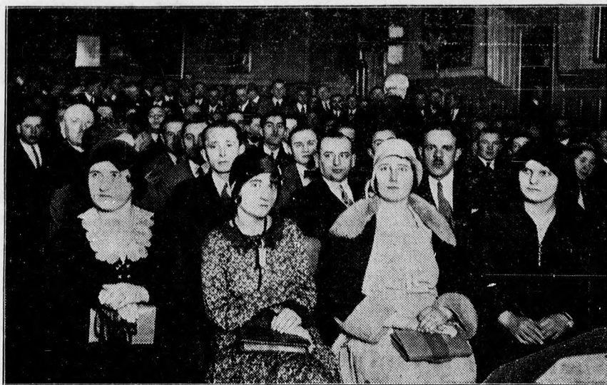
A Keréskedelmi Alkalmazottak Szövetségének nagygyűlése. A közönség egy része.