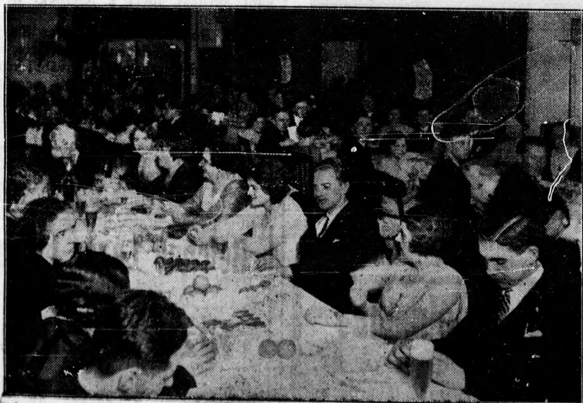
A nagyszerű Lilla-tea közönségének egy része.