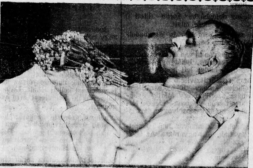
Hermann Müller német exkancellár a halottas ágyon. A világháború befejezése óta két ízben volt Németország kancellárja Hermann Müller szocialdemokrata vezér, akit most az egész német nép részvéte kíséri utolsó útjára.