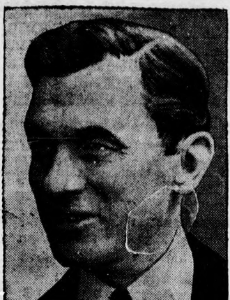
Jimmy Walker Newyork polgármestere, aki eddig nagy népszerűségnek örvendett. Most erős akcióit indítottak ellene, mert állítólag ellenzésével elősegítette a korrupció terjedését és ezzel aláasta a közigazgatást.

vidáció jog- y Ernő, az önyvalakban tó: Hegedűs eakodásában, ödj, mert az sztaóság. Fű-