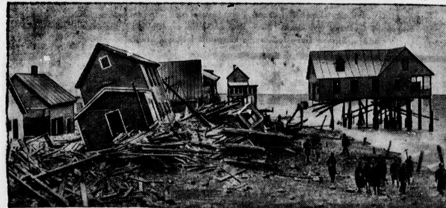
Az Egyesült Államokban is nagy vihar dühög. Képünk egy a vihar által elpusztított Boston mellett fekvő halászfalu romjait mutatja.

Két éve azt mondták, hogy a szovjetnek nem lesz pénze, amivel a program végrehajtásához szükséges dolgokat megvásárolja. Ma a helyzet az, hogy gépek és gyári berendezések egész hajórakomá-