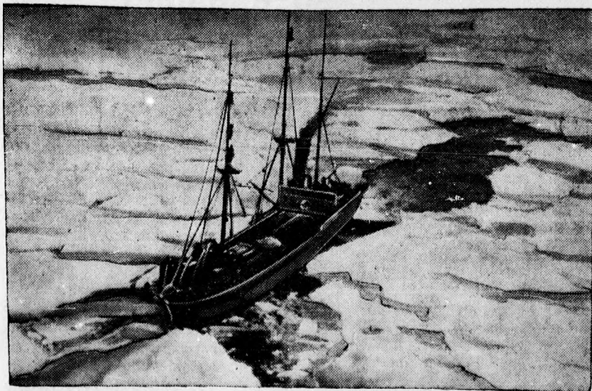
Huszonnyolc utasát fogták ki eddig holtan a tengerből a Wiking nevű főkadász hajónak, amely Newfoundland közelében felrobbant. — A hajón a Paramount filmgyár színészei voltak, akik egy sarkvidéki filmet akartak csinálni.