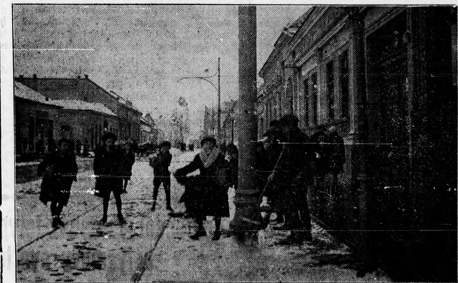
A pénteki nagy havazás. Pénteken reggel hirtelen hatalmas sötét hófellegek borították be az eget s csakhamar olyan hóesés kerekedett, amilyen télen sem igen volt. Rövid idő alatt hó lepte be az uccákat — a gyerekek nagy öröme.

Debrecen város a mezőgazdasági kiállításra öt darab díjat nyert, államilag törzskönyvezett tehenészetekből származó tarka bikát vett, amiket a belső csordajárásokra, még pedig a füzfa-csöszházi és a köntösgáti északi legelőre fognak beosztani. Miután ebben az évben előreláthatólag úgy a magyar fajta, mint a tarka szarvasmarha törzskönyvezése Debrecenben is megvalósul, az e bikáktól származó borjúk már törzskönyvezett jószágok ivadékai lesznek s így drágábban is értékesítheti