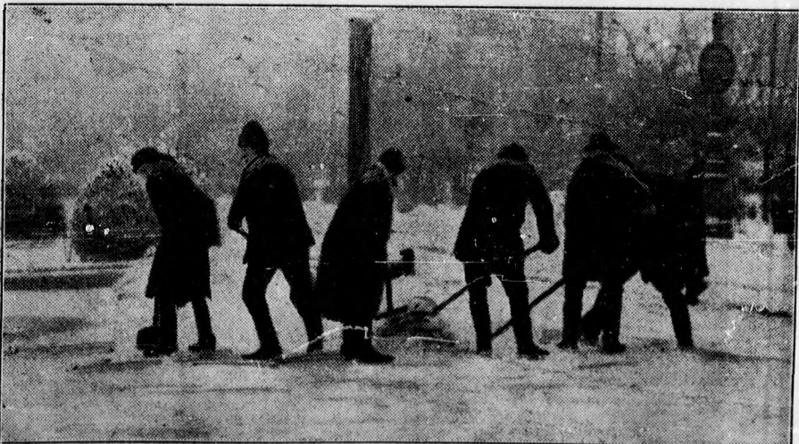
Pénteken szokatlanul nagy hóesés volt Debrecenben. — A szegény emberek megőrültek, hogy valami kereset akad majd a hóeltakarításával. Egyes helyeken hozzá is kezdtek az eltakarításhoz, de közben hosszabb-rövidebb időre a nap is kisütött s a hó az aszfalton hamar elolvadt.