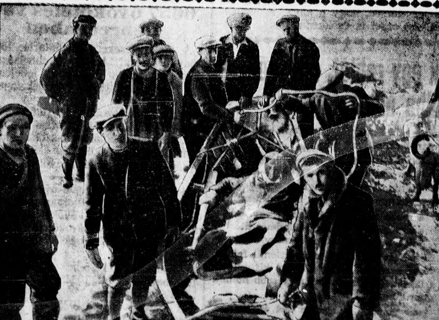
A sarkvidéki hajókatasztrófa utolsó felvonása. Hetek óta tartó gyötrelmes szenvedés után került most szárazföldre egy mentőcsónakon az a néhány utas, aki túlélte a Viking katasztrófáját. A Viking nevű fókahajó ugyanis felrobant és a hajón tartózkodó amerikai filmszínészek túlnyomó része a tengerbe veszett. A Viking utasai a sarkvidéken akartak egy filmdrámát készíteni és a filmdrámából a sors valóságos drámát csinált.

— Mesedélután a KIE-ben. Vasárnap délután a KIE mesedélutánjára nagy meglepetéseket tart a rendezőség. A hatalmas műsoron szobrászati-rajzok, mesék, mókák, játékok, filmek, szavaltatok, énekek és zeneszámok szerepelnek. Sikerként megnyerni a fellépésre Borsos Irénkét és Pontos Magdát is. Gyerekek, készüljétek a Bendegúz bácsi által kisorsolt játékok kiosztására is! Műsört 20 fillérről előre lehet kapni Lám Sándornál a Piac ucca 5. szám alatt.