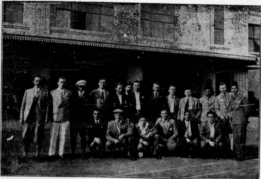
A Bocskay csapata a kairói mezőgazdasági muzeumban. A muzeum magyar terv alapján készült.