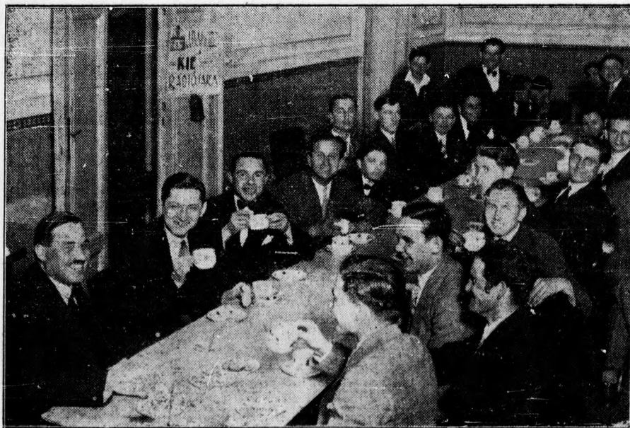
A KIE jól sikerült vitaesté keretében téaestet adott. Képünk a jókedvű közönség egy részét mutatja.