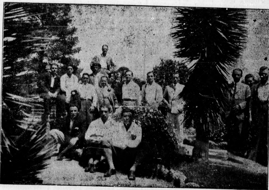
A Bocskay egyiptomi turájáról. — A csapat a kairói állatkertben.