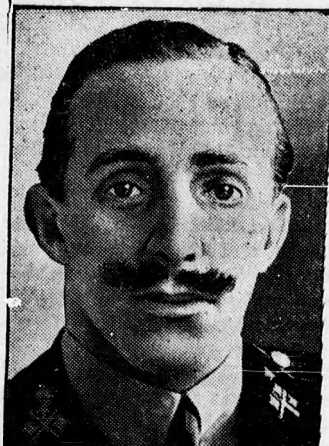
XIII. Alfonz spanyol király.

Csütörtökön délelőtt érkezett Párisba az a különvonat, amelyen Ena spanyol exkirályné öt gyermekével megérkezett. A Párisban élő spanyol arisztokraták megjelentek a pályaudvaron és lelkes ünneplésben részesítet-