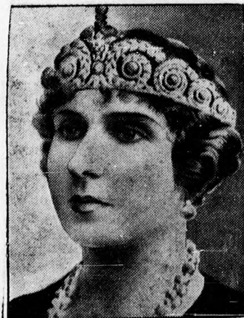
Ena spanyol királyné.

az elmúlt esztendőök szörnyű csapásaiért kizárólag Alfonz exkirály felelős, aki teljesen kezére adta az országot a korrump és kegyetlen katonai diktátoroknak.