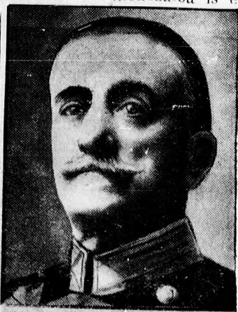
Aznar tengernagy, az utolsó spanyol királyi miniszterelnök.

Az illető kapitányokat úgy tekintik, mintha életben lennének, sőt a jövőben magasabb rangfokozatba is emel-