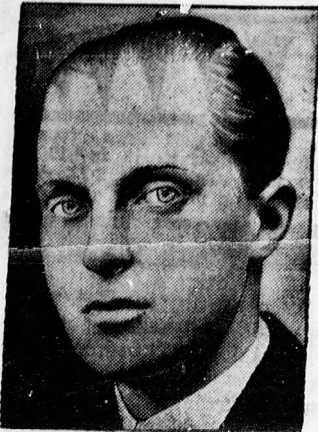
Alfonz spanyol király (trónörökös).

tek szabadon, Valenciában pedig 600 fogoly szabadult ki.