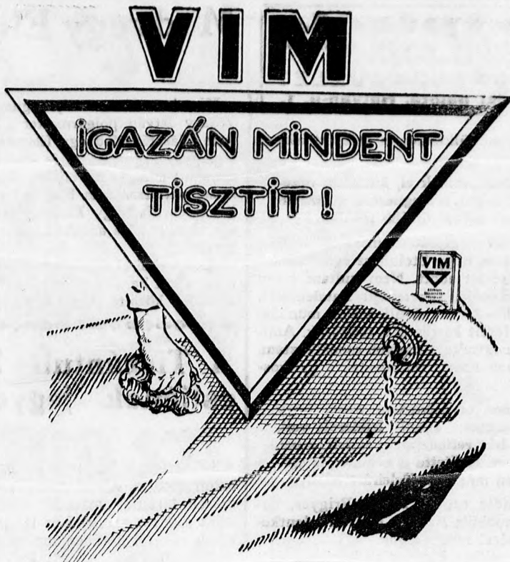
AZ ÖN FÜRDŐSZOBÁJÁBAN IS 10 HELY VIMRE VÁR.