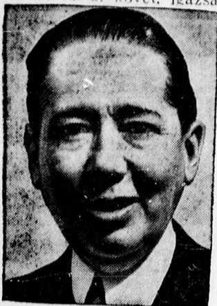
Titulescu volt külügyminiszter, londoni román követ, az új román miniszterelnök

Budapest, április 17. Magánjelentés szerint a Titulescu kormány összetétele a következő: Miniszterelnök és belügy-miniszter Titulescu, külügyminiszter Joan Ghica, román követ, igazságügy-