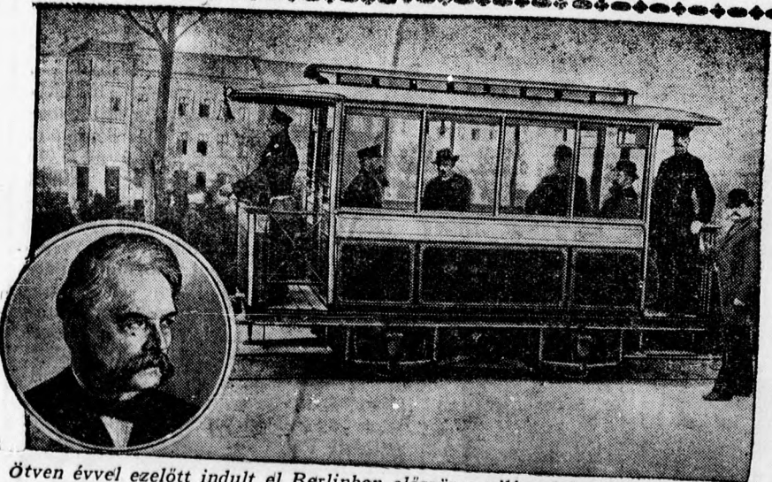
Ötven évvel ezelőtt indult el Berlinben először a világ első villamoskocsija (fenti kép), amelyet Werner Siemens, a híres gépgyáros (baloldalt alul) konstruált. Valószínű, hogy ötven év múlva már nyoma sem lesz a villamosnak, márt a nagyvárosok uccáiról lassan kiszorítja az — az autó.

Évekkel ezelőtt megbukott egy Lehár operett: A sárga kabát. A darab ostoba librettóját Lehár kedves melódiái sem tudták megmenteni s ugy ezek minden értékük ellenére sem tehetek szert népszerűsége. Lehár azonban nem nyugodott, a partitúrához új szöveget keresett és mint egy megkopott ruhadarabhoz illik, a sárga kabátot átfordította. Így lett a sárga kabátból A mosoly országa. A szabó azonban ezuttal sem remekelt. Roman-tika helyett naivitás a keleti történet vezérfonala és ez sehogysem simul a nehezebb fajsúlyu muzsikához, amely, ha nem is eredeti teljes egészében, mégis értékes s hangulatkeltő. Eppen ezért a darab, illetve a film két részre osztható. Tartalmilag unalmas és élvezhetetlen és a szereplőknek nem is nyílik alkalmuk játékra. A zene azonban kedves és a rádióból, gramofonból már közismert melódiák jól érvényesülnek a kitünő énekesek interpretálásában. Ebben Tauber Richárd vezet, akinek érces tenorja illuziót keltő és igazolja világhírét. Mellette a kis kínai lány naiv kedvessége hat kellemesen.