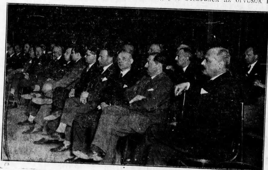
Az orvos-szövetség közgyűlése a városháza dísztermében.