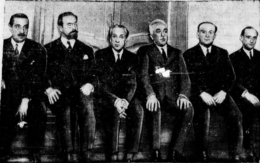
A spanyol köztársasági kormány; balról jobbra: Miguel Maura belügyminiszter, Fernando de los Rios igazságügyminiszter, Alvaro de Albornoz, Alcala Zamora miniszterelnök és államfő, Caballero munkaügyi miniszter, Casares Quiroga tengerészeti miniszter.

az olasz-spanyol kereskedelmi szerződést fel fogják mondani.