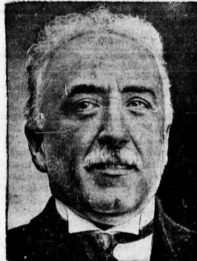
Alcala Zamora, a spanyol köztársaság elnöke és miniszterelnöke.

korlátozni. Több miniszter kijelentette, hogy a szövetséges köztársaság alkotmá-