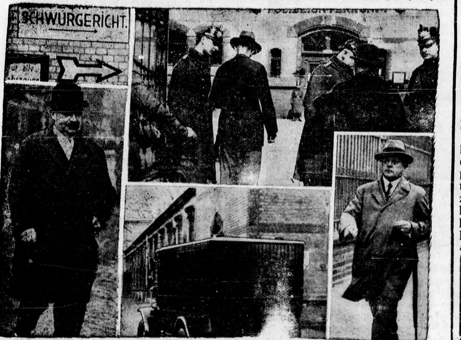
A düsseldorfi kéjgyilkos bünperének a tárgyalásáról. Fent balra: Az ut a tárgyalóterembe. Lent balra: Rose tárgyalási elnök. Fent jobbra: A rendőri ellenőrzés a tárgyalóterem előtt. Lent közepén: A foglyszállító autó, amelyen a törvényszékre viszik Kürtent. Lent jobbra: Dr. Eich táállamügyész.

Műszerész és villanyszerelő Ozletemet május 1-én Simonffy ucca 16. alól Hatvan ucca 18. NAGY, műszerész.