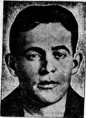
Jack Diamond, az amerikai alvilág egyik vezére, a híres csempész, akit most ismeretlen tettesek egy amerikai korcsmában revolverlövésekkel súlyosan megsebesítettek s most állítólag haldoklik.

Csipekék legolcsóbban és legnagyobb választékban nálunk kaphatók CSIPKESZAKÜZLET Püspöki p. 10. Hatvan-u. 1.