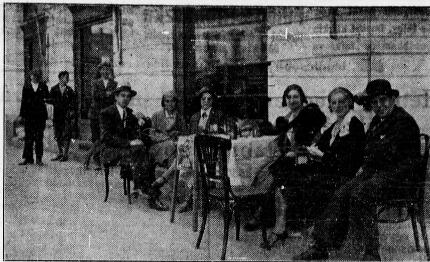
Az anyák napja. Gyűjtő csoport a Hungária előtt.