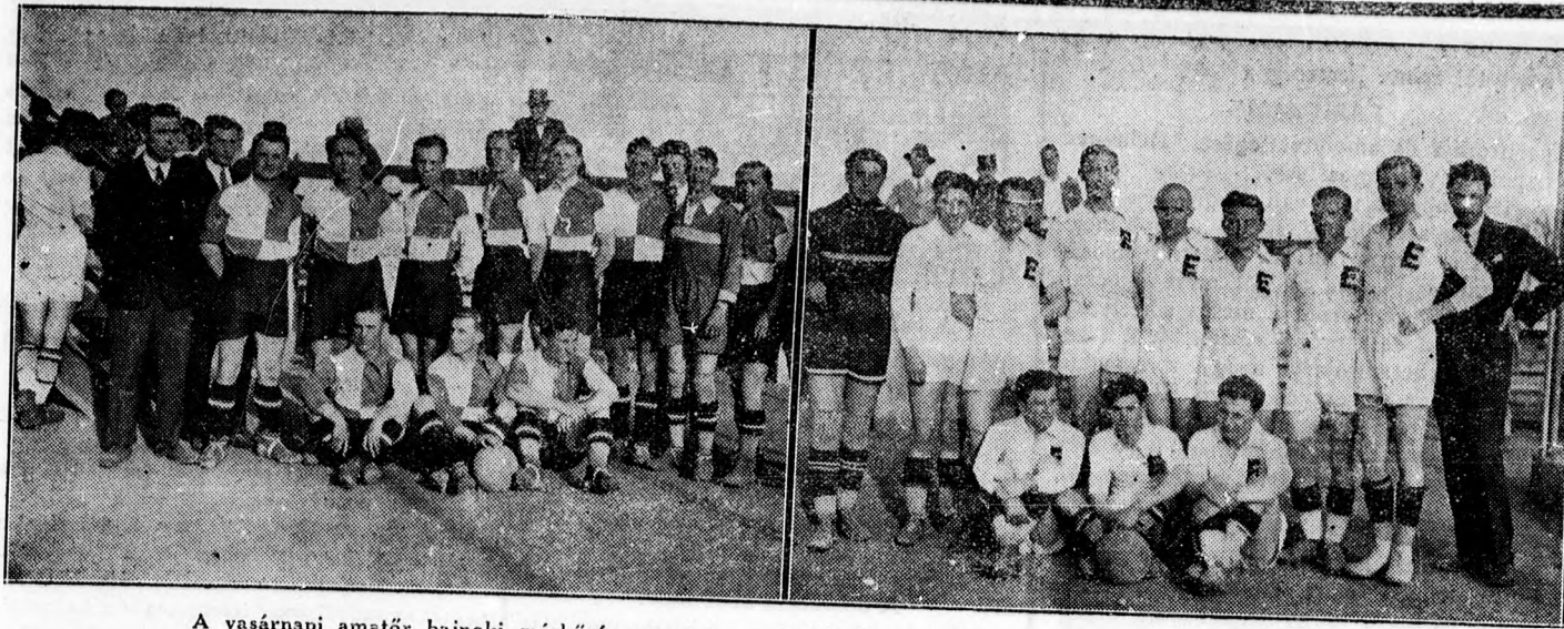
A vasárnapi amatőr bajnoki mérkőzés csapatai. — Baloldalon a DVSC, jobboldalon a DEAC csapata.