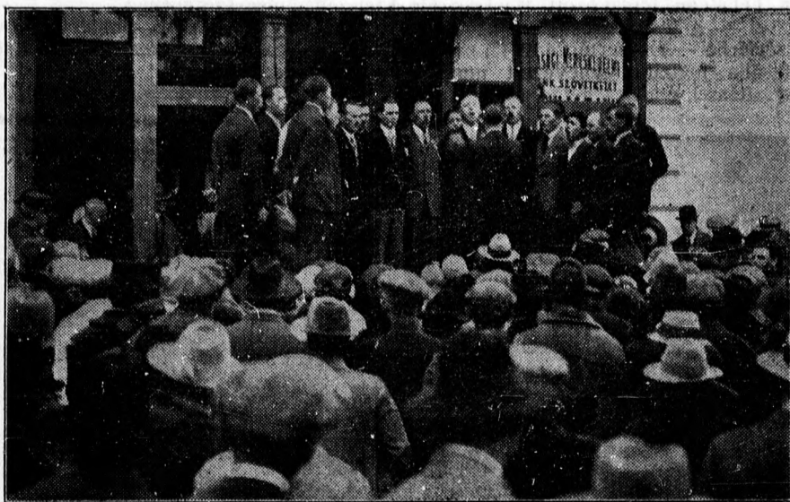
A debreceni munkásság május elseji ünnepe a Munkás Otthonban. A szavalókórus.

— Tessék adni kezit csókolom, egy pár fillért, mert szegény apukám nagyon beteg és nem tud keresni. Anyukám meg már meghalt és hat testvérkémmel vagyunk