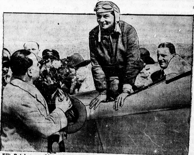
Elli Beinhorn, a híres német pilóta hazaérkezése afrikai utjáról Berlinbe, ahol ünnepélyesen fogadták.