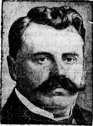
Udzral, a cseh miniszterelnök, aki hír szerint kormányával együtt lemond az agrárpárt erős támadásai miatt.