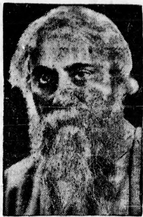
Rabindranath Tagore, a hindu bölcs és költő szerdán 70 éves.

A betörővezér különben ismert alakja volt a debreceni korzónak. Gazdászos, divatos ruhájában sétálgatott és udvarolt az ismerkedésre és a sokpénzü gavallér kinézésű ifju támogatására számító elegáns nőcskének. Gulyás gavallér is volt, szórta a pénzt: a lopott holmik árát. Ideális alapon is udvarolt egy urileánynak és a család már úgy is tekintette, mint vőlegényt. Özvegy Wallnernél vadházasságban élt és szépen berendezett lakásuk volt a Bercsényi utcán. Az özvegy híven kitarított Gulyás Árpád mellett és szorgalmasan küldte részére a pénzt, ha a vakmerő betörő egyszer-egyszer letartóztatásba került. Az évekig tartó szerelmi viszonyt háborúság váltotta fel Debrecenben, mert a szerelmes szívű özvegy rájött arra, hogy Gulyás Árpád Dalvölgyi Loránt álnév alatt hordítja az ifju nőket és hevesen udvarol egy urileánynak is. A féltékeny özvegy megbízott egy fiatal debreceni lakatossegédet, hogy járjon utána Gulyás dolgainak és tudja meg azoknak a hölgyeknek a címét, akikkel ismeretségben áll. A magánnyomozó dolgozott is egy ideig békésen, de aztán nem tartotta tanácsosnak kikezdeni Gulyással és lemondott a megbízatásról.