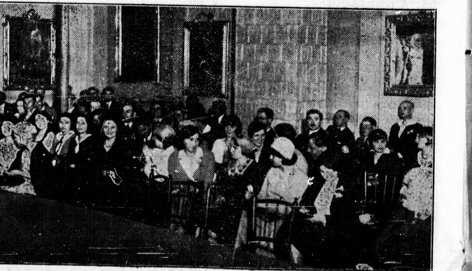
A debreceni bölcsészkongresszus keddi ülése. A közönség egy része.

Nagy érdeklődés nyilvánult meg dr. Lábán Antal, a bécsi Collegium Hungaricum igazgatójának előadása iránt. Előadásában a külföldön járó bölcsész-hallgatók propagandamunkájáról beszélt