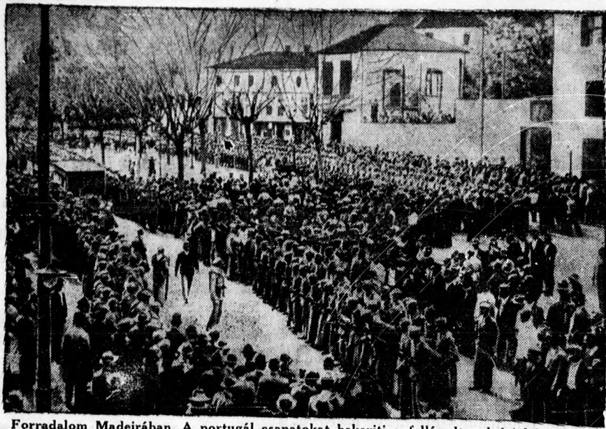
Forradalom Madeirában. A portugál csapatokat bekeríti a fellázadt polgári lakosság.