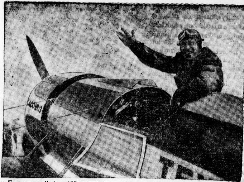
Hawk Ferenc amerikai repülő 2 óra 55 perc alatt repült Londonból Berlinbe.