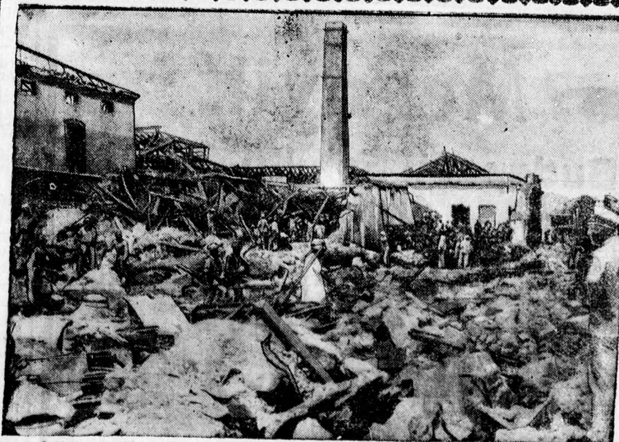
Óriási gyári katasztrófa a braziliai Niheroy városban. A niheroy-i torpedógyárban robbanás történt, amely elpusztította a gyárat. 2000 ember súlyosan megsérült, 150 meghalt.

kezik Debrecenbe és hozzáfog sátorvárosának a felépítéséhez. Megérkeznek ekkorra már a bihari, szabolcsi, szatmári, kun cserkészek, akik egyes altáborokban helyezkednek el a nagy tábor területén. Micsoda munka lesz az 1500