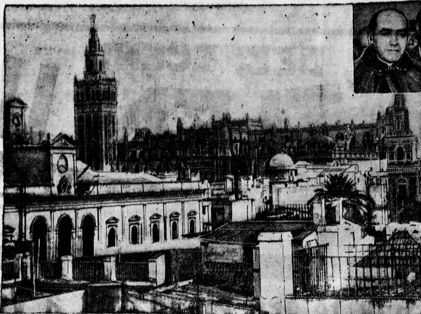
A világ második legnagyobb temploma, a sevillai katedrális, amelyet a spanyol forradalmi mozgalmakban szintén felgyújtottak.