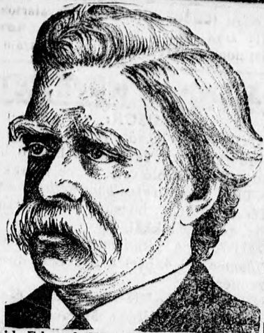
David Edward Hughes, a tudós világ most ünnepi születésnapjának századik évfordulóját. Hughes volt a feltalálója a Hughes-féle távirónak és a mikrofonnak.

Átvették a Szoboszlói uti próbaburkolatot. A Magyar Aszfalt Rt. két évvel ezelőtt a Szoboszlói uton bitumac próbaburkolatot készített azzal, hogy két év múlva abban az esetben, ha a burkolatot megfelelően találják, a létesítési költség esedékes lesz. A két év most letelt, a burkolatot a felülvizsgáló bizottság kifogástalanul találta és így a Magyar Aszfalt Rt. kiutalták az 5800 pengős burkolási költséget.