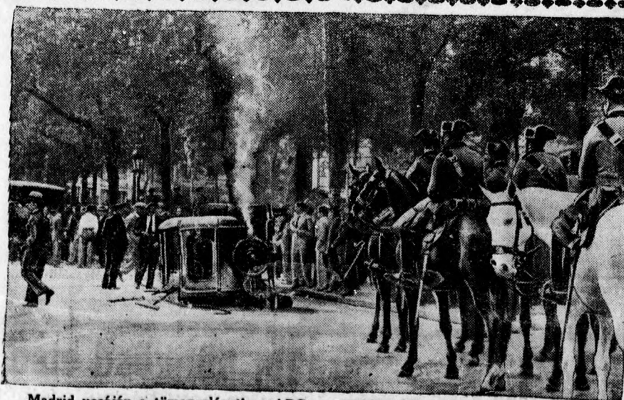
Madrid utcáján a tömeg elégeti az ABC monarchista lap szerkesztőjének autóját.