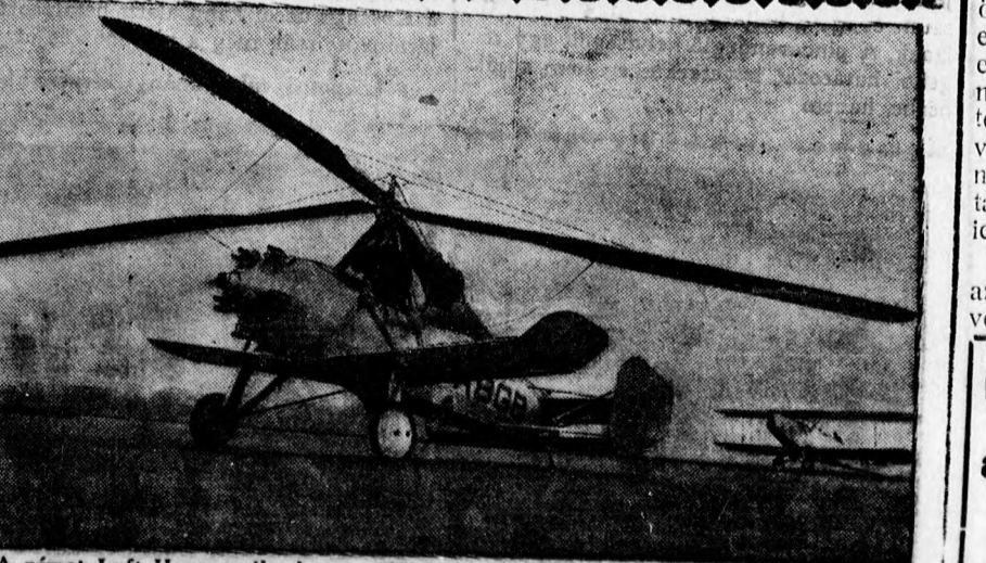
A német Luft Hansa szélmalom-repülőgépekkel kísérletezik, mert a személyszállítási szolgálatára ilyen gépeket akar beállítani.

ma délből a rendőrségen, miként jutott tudomására ez a furcsa história. Tegnap arról értesült a hivatalban, hogy az Országos Társadalombiztosító Intézet érdeklődött hivatali főnökénél, hogy felgyógyult-e már a gyerekágyból. A hivatalban megrökönyödéssel hallották a kérdést, mert a tisztviselőnő a hivatal tudomása szerint nincs férjénél és nem is hiányzott az alatt az idő alatt, amikor állítólag gyermekét megszülte volna. Értesítették a furcsa ügyről az érdekelt