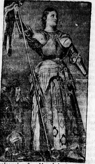
Az orleansi szüz elégetésének most van 500. évfordulója. Jean d'Arcnak, mint vezérnek roueni szobra.