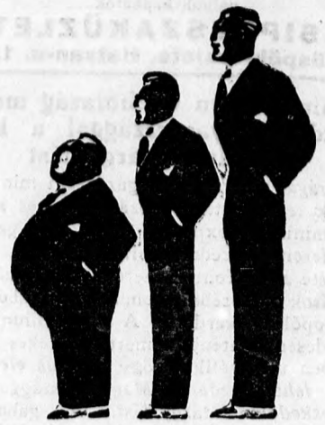
A legmegfelelőbb ruhát a legolcsóbb árban vásárolhatja