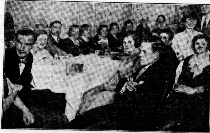
A résztvevők egy csoportja a Szent Erzsébet Egyesület fagyaltdélutánján.