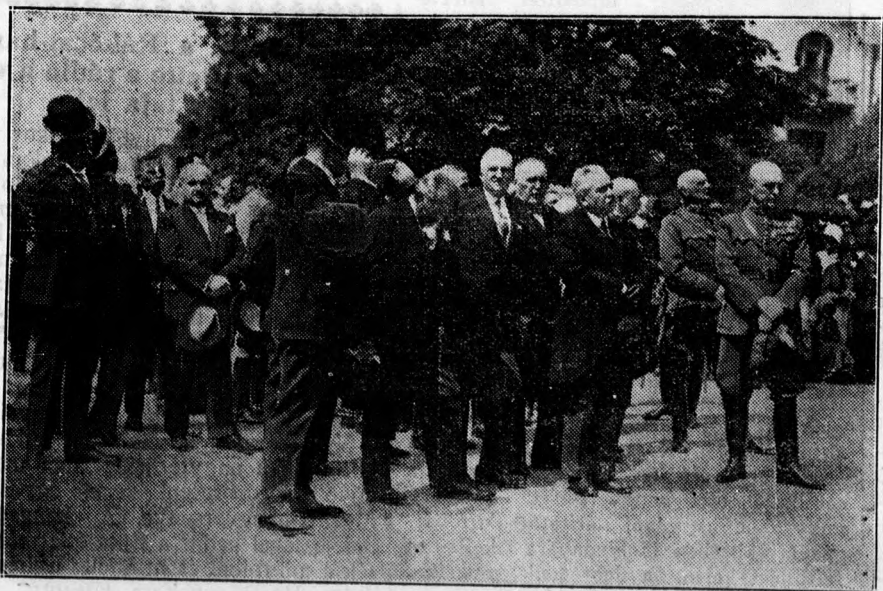
Előkelőségek az urnapi körmenetben.