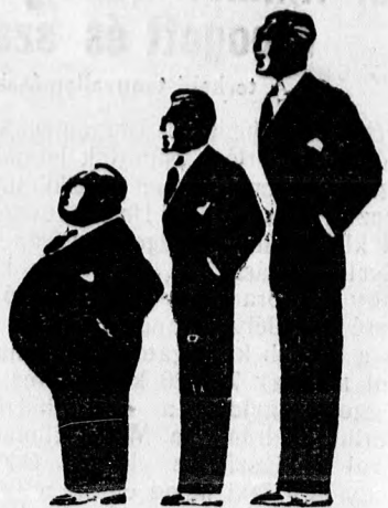
A legmegelőkelőbb ruhát a legolcsóbb árban vásárolhatja