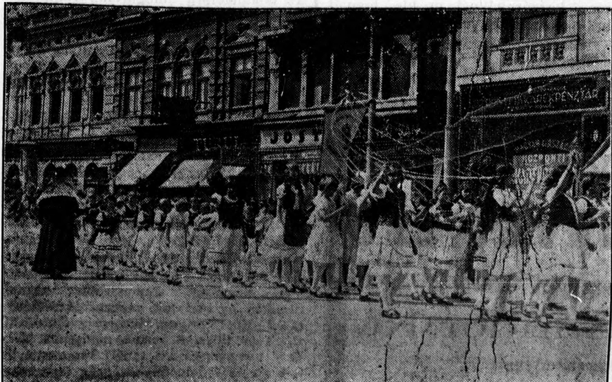
Az urnapi körmenet. Magyar ruhás leánykák viszik a templomi zászlót és a szalagokat.

A belügyminiszter visszaküldte Debrecen városnak a köztemetői szabályrendeletét, amelyre vonatkozóan több lényegtelen és két lényeges észrevétel tett. Az egyik lényeges észrevétel szerint a köztemetőnél meg kell szervezni a tisztikart. Ezzel szemben a bizottság elegendőnek tartja, hogy a X. fizetési osztályban megszervezzék a gondnoki állást, a többi állást pedig költségvetési évenként a szükséghez képest a polgármester töltsse be. Másik lényeges észrevétel szerint a belügyminiszter úgy látja, hogy a szabályrendelet 12. szakaszának az az intézkedése, hogy a ravatalozó bejáratától a temetkezési vállalkozótól minden tevékenységet a város vesz át, tulajdonképpen a temetkezési tevékenység községegységének burkolt ki mondása. Épen ezért ebben a kérdésben határozott állásfoglalásra hívta fel a várost. A jog- és pénzügyi bizottság hosz-