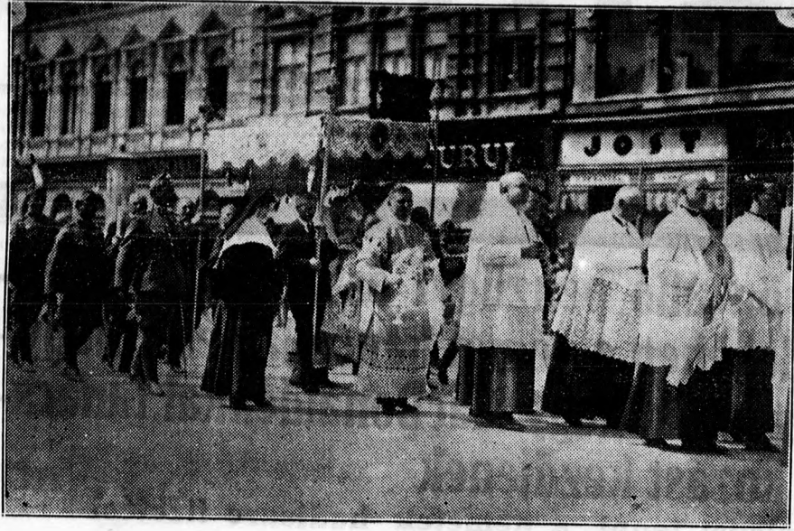
A debreceni urnapi körmenet. A baldachin alatt vitt Oltárszentség éjött a papság halad.