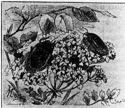
A szerecsen poloska. (Eurygaster maurus.)

Később 20-30 centiméter magas leveleket öl el, fél magasságban szurásával, úgy hogy a buza levelein, sőt sziklevelein is olyanok, mintha félmagasságban le volnának rágva. A következő kárszakasz 8-10 nappal a kalászhá-