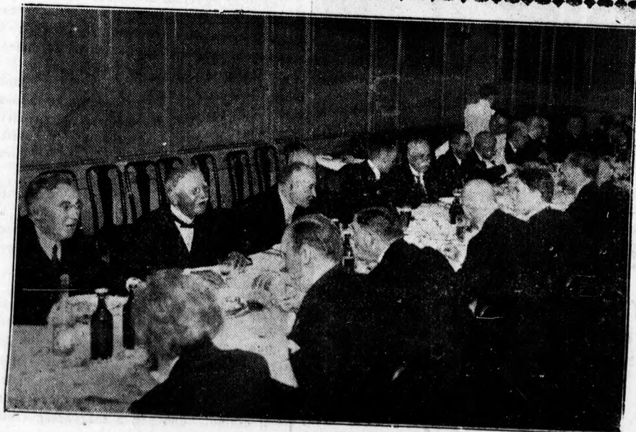
Az egyetemi ünnepi ebéd résztvevői az Angol Királynőben.

beli alakulására nézve. Az első és a legfontosabb az, hogy a kormány meg fogja tiltani a jövő idényben a gabonahatáridőüzetek kötését. Az erre vonatkozó rendelet a közeljövőben megjelenik. Ugyanakkor fogják