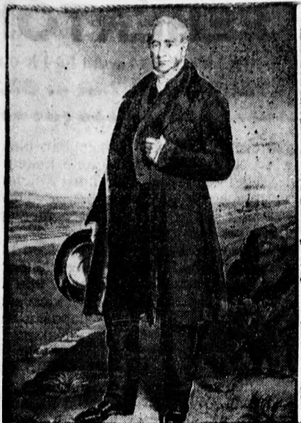
Stephenson György a vasut, illetve a lokomotív feltalálója. — Most ünneplik születésének 150. évfordulóját.