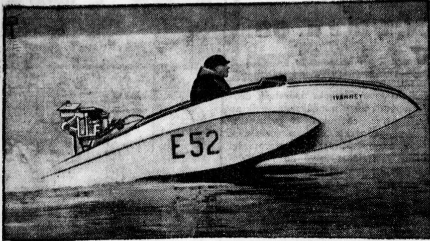
Ivaurey spanyol motoros versenyző próbautja a Potsdam mellett fekvő templini tavon. Ivaurey a világrekord birtokosa.

Hogy Weekend szórakozásának örömeit fokozza, lényképezzen az új magas érzékenységu angol Imperial filmre és lemezre Kapható BERZÉKI fotoszaküzletében, Piac-u. 38, az udvarban.