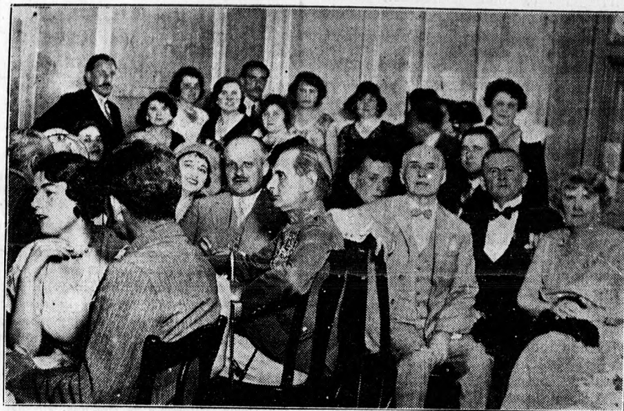
A Szent Erzsébet foglalt estje előkelő közönségének egy csoportja az Angol Királynő éttermében.