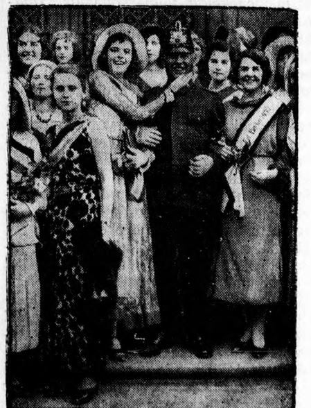
Németországban a „város szépségkirálynő”-jét választották. Összesen harminc ilyen szépségkirálynőt választottak, akik Berlinben jöttek össze. Mint a képen látható, a szépségkirálynők kedélyes leányok, akik körülveszik és cirógatják a rendőrt.

Debrecen város központi választmányát így hétfőre összehívták.