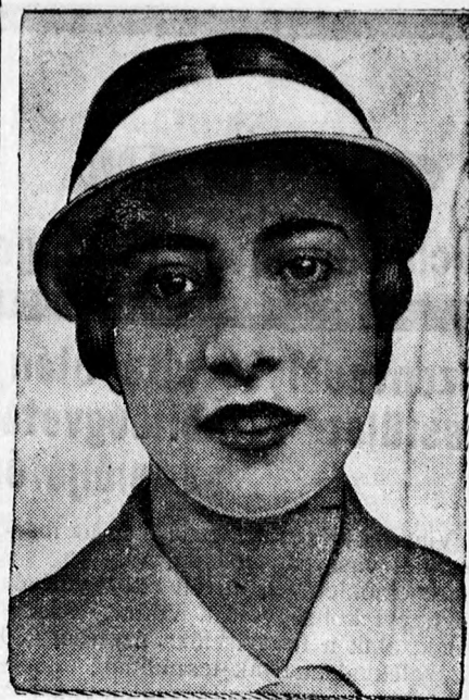
Cilly Auscem, a német teniszbajnoknő most lett Franciaország bajnoknője.