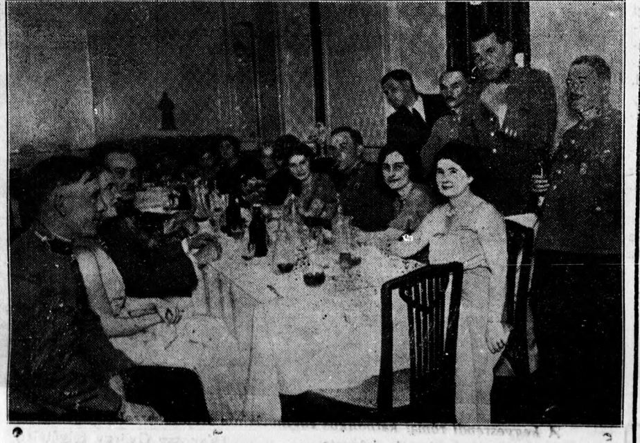
A Békessy Béla Vivó Club nagyszerű estélyt tartott az Angol Királynő zöld termében. A képünk a résztvevők egy csoportját mutatja.

Elmondja a szakaszvezető a feljelentésben, hogy az ő távollétében feleségét szülési fájdalmak lepték meg. A szülesznő azt tanácsolta, hogy telefonáljanak orvosért s át is küldött egy gyermeket a közeli gyógyszerertárho, ám a gyógyszerész elzavarta a gyermeket, megtagadta a telefonhívást. Az asszony később rosszábbul lett, mire a szülesznő még egyszer üzent, majd harmadszor is elküldött egy kisfiút a gyógyszerészhez, most már a mentők felhívását kérve. A gyógyszerész a harmadik üzenetnél levette a kagylót a telefonról — a feljelentés szerint — és úgy csöngetett. Természetesen nem szólott a csengő s a gyógyszerész ezt mondta is az üzenethozónak: