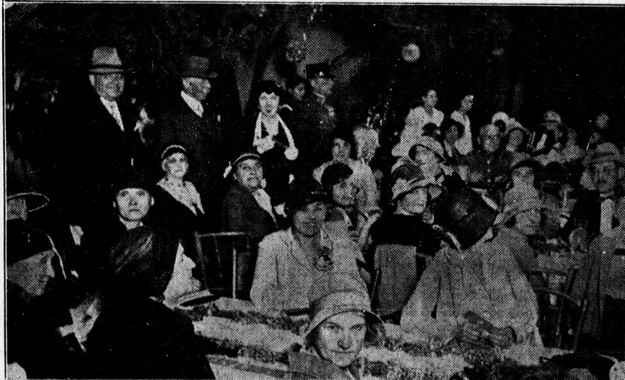
Kerti ünnepély a Jótékony Nőegylet intézetének kerthelyiségében. Az ünnepségen, amely igen jól sikerült, előkelő, szép közönség jelent meg.

a fasiszta Olaszországban ilyen névvel amugy sem tudott volna magának megélhetést biztosítani és azért kény-