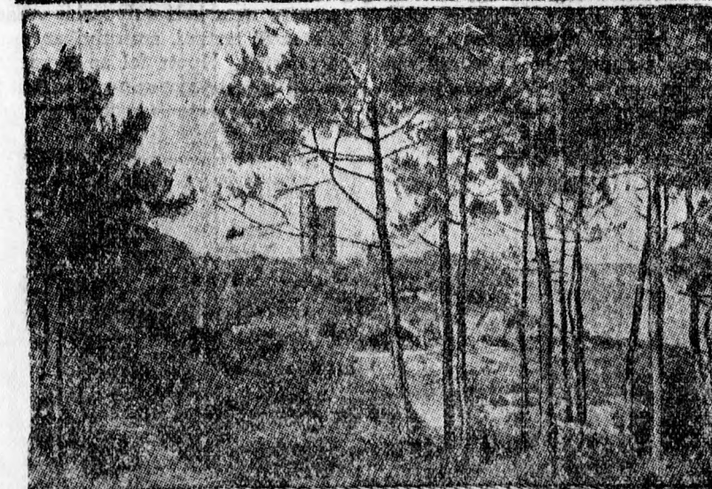
A nantesi borzalmas hajókatasztrófa színhelye. Felső kép: A St. Gildas szirtek, amelyek mellett a St. Philibert elsüllyedt 400 emberével. Alsó kép: A Noirmoutier sziget, ahonnan a kirándulók hazatérőben voltak, amikor a gőzhajó elsüllyedt.