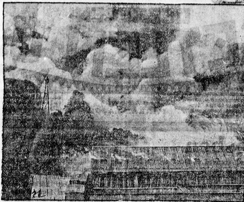
Az oslói kikötői raktár égése.

Néhány perc múlva megjelentek az akasztófiáktól néhány lépésnyire felállított és fehér abrosszal leterített asztal mellett a hivatalos sze-