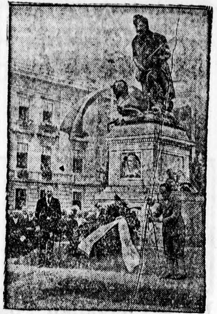
A volt 69. Hindenburg gyalogezred által felállított Hindenburg emlék. Az emlék felszentelésekor a szobor előtt von Schön német követ beszédet mond.

A — higiénika — legfontosabb a fodrásznál, ezt megtalálhatja Forgács uri és női fodrásznál, hol mégis olcsó és figyelmes kiszolgálás van. Hungária-palota Arany János ucca 2.