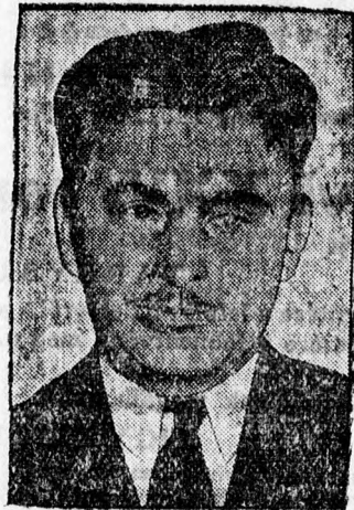
Az amerikai oceanrepülők Harold Gatty és Willy Post.

— A jog- és pénzügyi bizottság ülése. Debrecen város jog- és pénzügyi bizottsága június 27-ikén szombaton délután 4 órakor a városháza tanácstermében ülést tart. Az ülés tárgysorozata a következő: 1. Tisza István tér burkolatozási munkálatainak vállalatbaadása. 2. Négy új kut furásának vállalatbaadása. 3. Hősök temetőjében emelendő emlékmű építési munkái vállalatbaadása. 4. Világítási Vállalat telepén a kapcsolóház építésének vállalatbaadása. 5. Előterjesztés a Horthy Miklós utnak közművekkel ellátása tárgyában. 6. Telekmegosztási ügyek. 7. Kisajátítási ügyek. 8. Egyéb esetleges folyó ügyek.