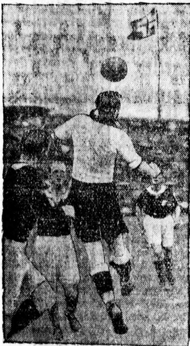
A német-norvég nemzetközi mérkőzés 2:2. — Az Oslóban lejátszott mérkőzés egyik jelenete: a norvég hátvéd fejeléssel tisztáz egy helyzetet.

ami a Vienna védelmével szemben teljes eredménytelenséget hozhat.