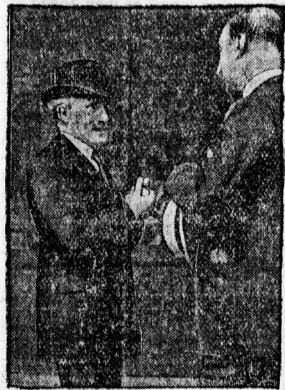
Arturo Toscanini, a világhírű dirigens, akit a faszisták internáltak Olaszországban, most már végre Bayreuthba érkezett, hogy előkészítse az ünnepi játékokat.

Általában megállapítható volt ma is, hogy úgy a készáruvásáron, mint a határidőpiacon feltűnően vontatott a forgalom. Csak a melírozhatatlan üzleteket kötik meg, mert a termérendelekek ügyében változatlanul nagy a tájékoztatlan-