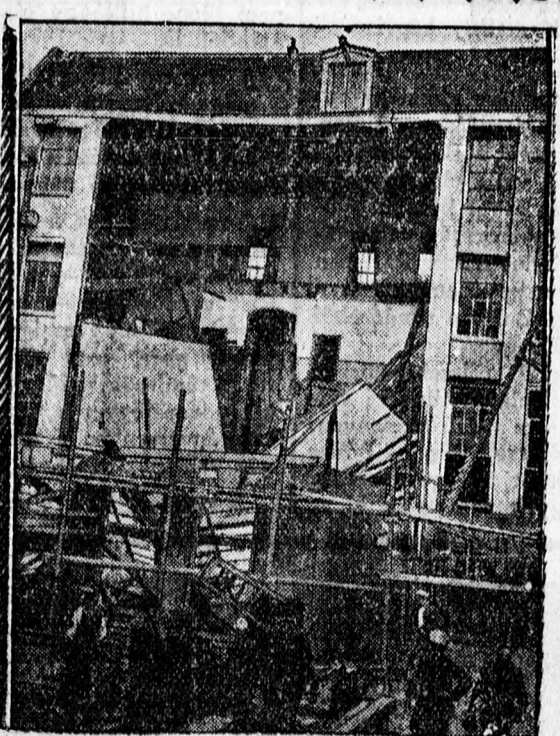
Súlyos házbeomlási katasztrófa Amsterdamban. — A vihar bedöntött egy házat, amelynek fala áttört a szomszéd ház falát is. Két ember meghalt.

Emlékezetes az az országos felzudulás, ami a népjóléti miniszternek azt a rendeletét fogadta, amelylyel a betegápolási költségeket kontingentálta. Debrecen város nyomban tiltakozott a rendelet ellen, panasszal is fordult a közigazgatási bírósághoz, azután pedig feliratban kérte a népjóléti minisztert, hogy emelje fel a város gyógyszerellátási kontingensét, mert a város súlyosan ráfizet erre. A népjóléti miniszter most küldött leiratában kijelenti, hogy a kontingens emelését nem látja indokoltnak, mert a számvevőség hó-