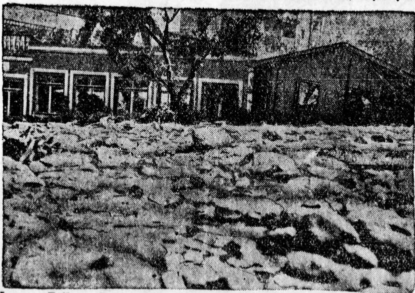
Kaprun, Zell am See mellett, amelyet iszaplavina öntött el. A képen látható, hogy az iszap az ablakok magasságáig ellepte a falut.

— Felhívás. A Frontharcos Szövetség vezetősége felhívja azokat a tagjait, akik a Frontharcos Dalos-csoport tagjai szándékoznak lenni, hogy pénteken este a Darabos ucca 16. szám alatt tartandó próbán sziveskedjenek megjelenni.