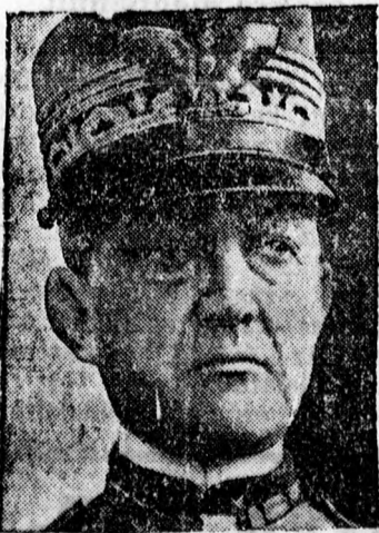
Savoyai Emanuel Filibert, az aostai herceg, az olasz király fivére, 62 éves korában meghalt. Temetése szombaton volt.

A szerdai tanácsi értekezlet megállapította, hogy a város új térképe épen most készült el és ezen ennek az utnak a neve Sétakert ucca. A város vezetősége nem akarja mindjárt úgy kiadni a térképet, hogy azon már időközben változás esett, így egyelőre marad az ut neve Sétakert uccának, később aztán lehet szó arról, hogy Beöthy Zsoltról nevezzék el, amit egyébként indokol az egyetemhez való tartozás és a nagy magyar esztétikus és irodalomtörténetíró nevének megőrzése.