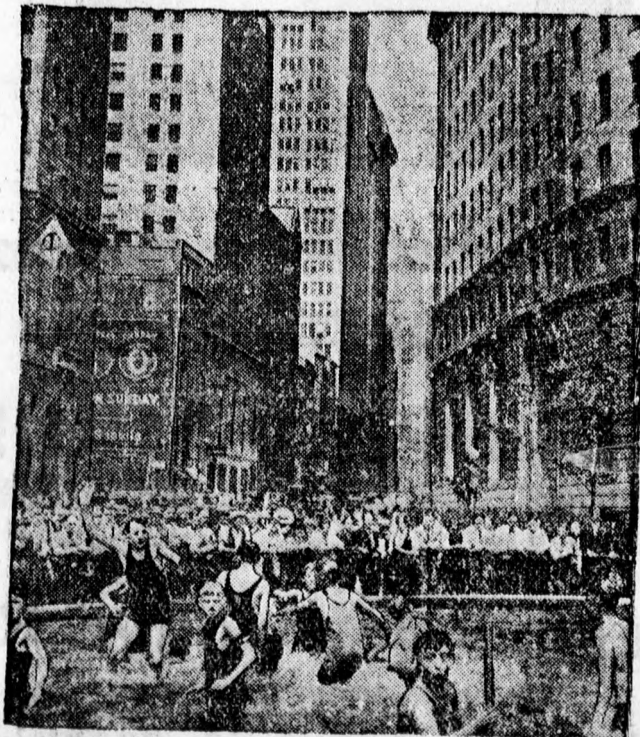
Newyorkban, ahol a 40 fokos hőség százával szedi áldozatait, a felhőkarcolók között a képen látható fürdőkben keresnek enyhülést az emberek.