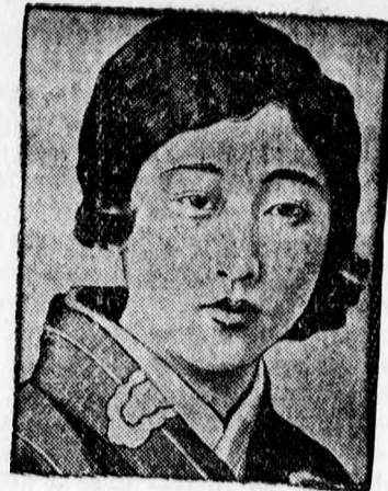
Miss Japán 1931.

A nagy kiabálásra elősiettek a Kovács család tagjai és a két le-