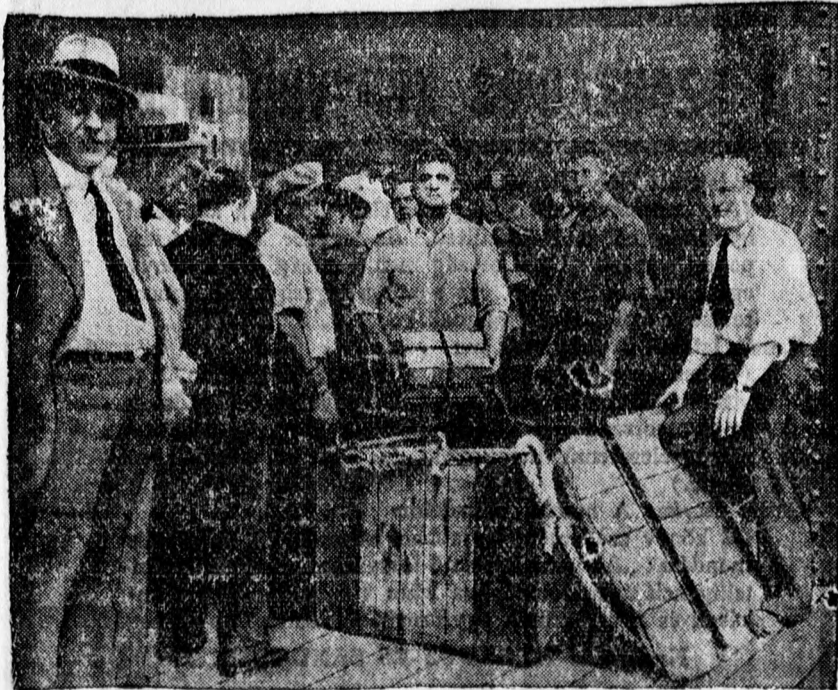
A német birodalmi bank harminc milliós aranyzállítványát Newyorkba érkezésekor átvizsgálják. Remélhetőleg ez lesz az utolsó ilyen szállítvány.

London, július 9. A Reuter-iroda washingtoni távirata szerint az amerikai külügyi hivatal kijelentette, hogy a francia-amerikai megállapodás bizonyos irányu határozatlansága ellenére Amerika feltételezi, hogy Németország nem teljesíti a jövő szerdán esedékes feltételes fizetési kötelezettségeit.